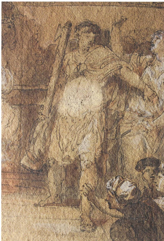
9 Détail de la figure 7 montrant une abrasion de surface sur la tunique du soldat qui retient la foule.