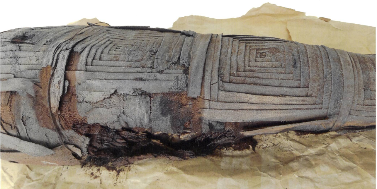
6 Momie d'oiseau, provenance indéterminée, Basse Époque ou période ptolémaïque. Ossements et textile, long. 50 cm. MAH, inv. 18304. Cet objet présente un état de dégradation tel que ne pas intervenir provoquerait la perte totale de la matière constitutive.