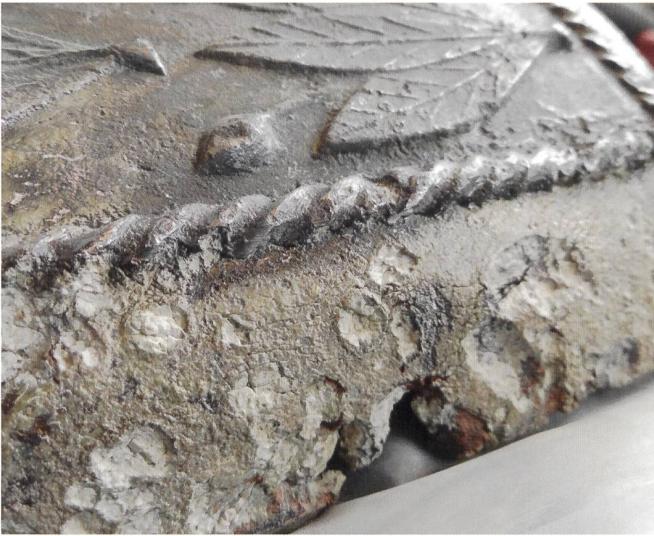
5 Sarcophage, Beyrouth, époque byzantine. Plomb au décor moulé, 65 x 19 x 24,5 cm. Direction Générale des Antiquités du Liban, inv. DGA 48998. Détail d'une œuvre en métal où sont visibles les trous laissés par l'action d'une corrosion dite « active ».