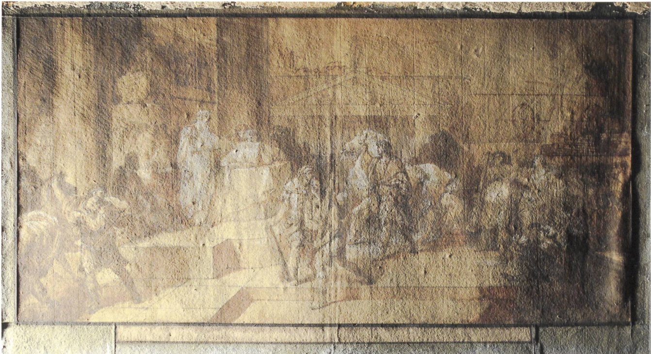
8 Vue générale de la figure 7 en lumière rasante: l'adhésion irrégulière de la feuille à son support est mise en évidence.