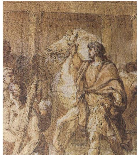
10 Détail de la figure 7: la foule et le traitement des têtes.