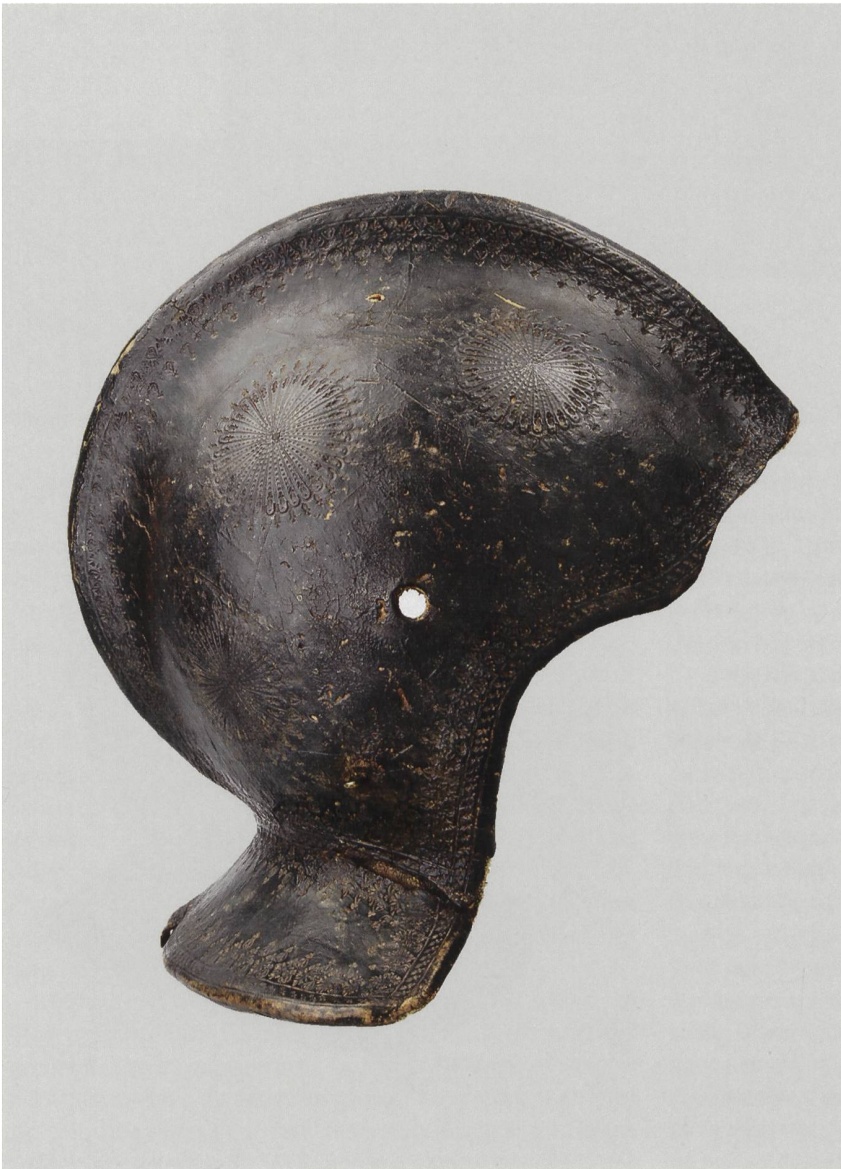
2 Armet, Italie, vers 1590. Cuir, tissu, laiton, fer, papier; long. 30,5 cm, larg. aux tempes 20 cm, poids 880 g. MAH, inv. C 912. Ce rarissime armet de parade en cuir et tissu était probablement complété à l'origine par une mentonnière-gorgerin, pièce mobile protégeant les tempes, la partie inférieure du visage et le cou.

des années tous les musées et arsenaux de l'Europe et les plus importantes collections d'amateur », mentionne à propos des arsenaux suisses qu'« il n'y a que ceux de Genève, de Soleure, de Lucerne et de Berne qui possèdent ce qu'on peut appeler une collection d'armes anciennes ». Parmi les dix pièces représentatives de la collection genevoise qu'il choisit de reproduire dans son ouvrage s'en trouvent cinq rattachées à l'Escalade et une autre, rarissime – « la seule arme de ce genre que l'auteur connaisse » –, à savoir le timbre d'un armet de parade en cuir et tissu, orné de petits motifs au fer à dorer, vraisemblablement fabriqué en Italie à la fin du XVI e siècle 14 (fig. 2).