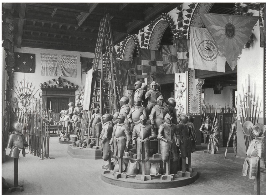
7 La Salle des Armures du Musée d'art et d'histoire, entre 1913 et 1915. MAH, inv. Bat 12.

En octobre 1907, on procède au démontage du plafond en menuiserie ornant une partie de l'ancienne Salle des Armures à l'arsenal, qui sera restitué et complété aux dimensions de la nouvelle salle du Musée d'art et d'histoire 32 . Celle-ci est livrée à Galopin dès le début de l'année 1909, c'est-à-dire environ quinze mois avant l'inauguration officielle. Son aménagement commence courant février par «un premier convoi d'armures, d'armes en râteliers ou emballées en caisses», les transports de l'ancien arsenal au nouveau musée se succédant à intervalles irréguliers jusqu'en décembre. À la fin de l'année, la grande salle est «presque entièrement installée,