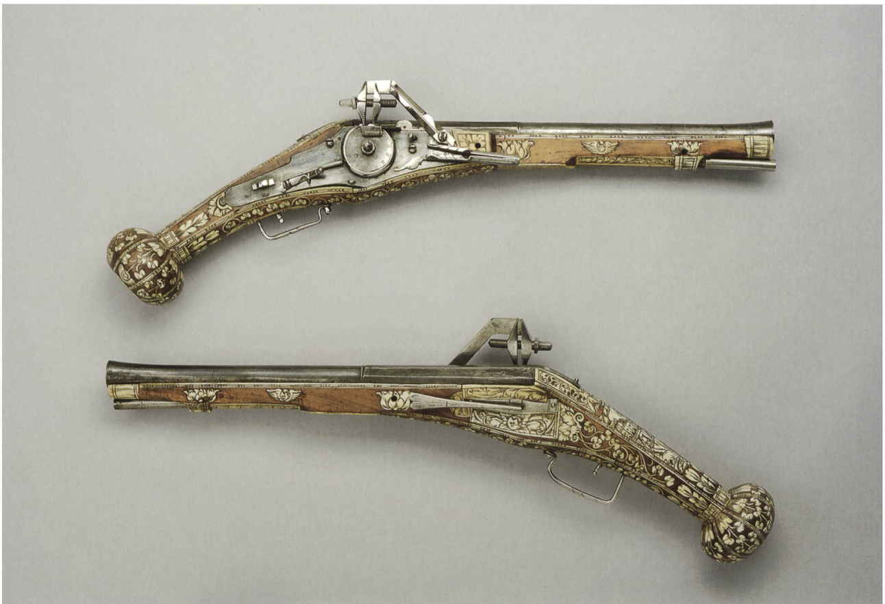
6 Paire de pistolets à rouet, Allemagne du Sud, vers 1575. Acier, bois, os; long. 57 cm, poids 1920/1860 g. MAH, inv. A 7 et A 8.

Un petit nombre de témoins iconographiques permettent de compléter ces descriptions (fig. 4 et 5) : comme jadis, les solives du plafond sont garnies de morions et de cabassets en rangs serrés, tandis que l'espace des murs est presque entièrement occupé par des alignements de casques et de cuirasses. On y retrouve également les compositions décoratives en « panoplie » déjà présentes au Palais de Justice, dispositif scénographique récurrent des présentations muséales de l'époque. Au fil des ans, d'autres aménagements sont apportés, dont l'installation régulière de nouvelles vitrines, indispensables à la préservation et à la bonne conservation des objets, et plus spécialement des pièces de valeur ou d'importance historique 25 . C'est donc avec satisfaction qu'en 1901 le successeur de Gosse, (Jean-)Louis Bron-Dupin (1849-1903), peut écrire qu'a été mise sous verre « la précieuse collection des pistolets 'de Pinchat' », qui est « une curiosité rare, car aucun musée ne possède un nombre aussi considérable de pistolets à rouet de cette époque » 26 . Même si la provenance historique de ces pièces est à nuancer, il n'en demeure pas