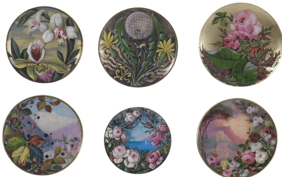
6 Médaillons, Louis Pautex, Genève, entre 1880 et 1900. Or et émail peint sous fondant. MAH, inv. AD 87/120 à 124/228/234.

beaux-arts. Les salles sont ordonnées par typologie d'objets et par matériaux: les objets conservés concernent les travaux du bois, des métaux, de la pierre, de la terre (céramique), ainsi que des textiles et des estampes. Une Bibliothèque « composée en vue de besoins de nos industries d'Art et de tout ce qui est du domaine des Arts décoratifs » complète l'exposition (fig. 7). La quatrième salle est réservée aux émaux, bijoux, montres et objets précieux en général: deux collections de montres y sont réunies, provenant l'une du Musée archéologique (50 pièces des XVI e – fin XVII e s.), l'autre commencée lors de la fondation du Musée des arts décoratifs (120 œuvres de la fin du XVIII e s. et première moitié du XIX e s.). 20 La proximité des œuvres constitue l'offre principale du musée en permettant, comme le souhaitent les radicaux, d'améliorer la formation des ouvriers: le Musée des arts décoratifs attire donc en majorité des consultants professionnels 21 .