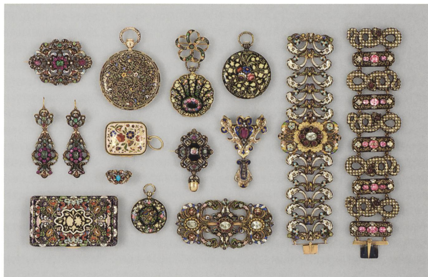
2 Montres, bijoux et objets de vertu, Genève, XIX e siècle. Or et décor d'émail polychrome, gemmes. MAH, inv. M 465 b/c/d, M 916, AD 7307, E 380, AD 285 bis, BJ 497, E 317, M 797, AD 8003, AD 9751, BJ 438.

L'influence positive de cet enseignement se lit dans le perfectionnement du décor de la boîte de montre, à tel point que, attentifs à ce bénéfice, les artisans et chefs d'atelier des industries d'art pressent les autorités de créer des infrastructures de formation. Des exemples européens associant déjà écoles et musées ouvrent une perspective de professionnalisation, liant enseignement du dessin, utilité de l'art, promotion des artistes locaux et désir de musée 9 . L'enseignement des arts appliqués repose dès lors sur trois piliers d'égale valeur : la formation pratique dispensée par des professeurs expérimentés