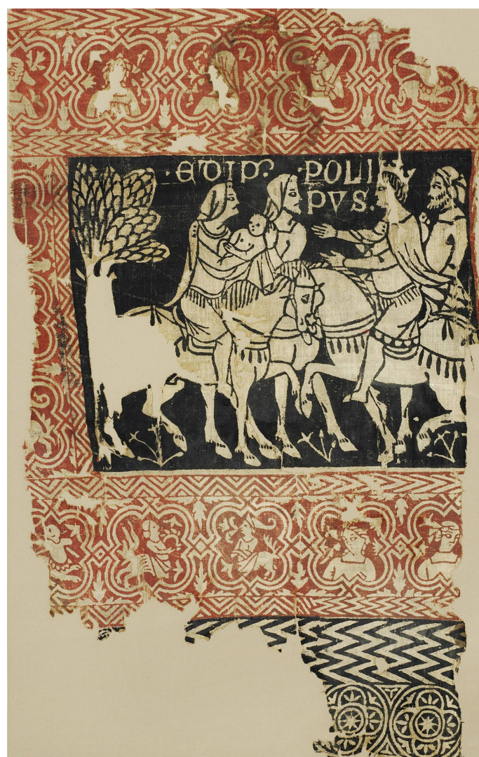
10 Toile de Sion, fragment conservé à Berne, ayant appartenu à la Municipalité de Berne. Haut. 58 cm, larg. 36 cm. Musée d'Histoire, Berne, inv. 701.

Ces toiles s'apparentent beaucoup aux peintures murales qui, au cours du XIV e siècle, ornent de plus en plus les parois des châteaux forts et des palais de scènes courtoises et chevaleresques. On y retrouve la présence d'un cycle narratif et la même palette, restreinte à quelques couleurs seulement. Les textiles d'ameublement, facilement transportables, sont très appréciés par les seigneurs et leur famille qui mènent une vie itinérante entre leurs différentes possessions 31 . Ces deux tentures devaient être suspendues au mur d'une pièce, de réception probablement. Pour couvrir plusieurs parois, comme le voulait l'usage, elles étaient peut-être placées l'une en face de l'autre. Bien que jusqu'à présent aucune source ne l'assure, il est néanmoins plausible que, comme le propose Keller, l'évêque de Sion ait paré son palais de ces