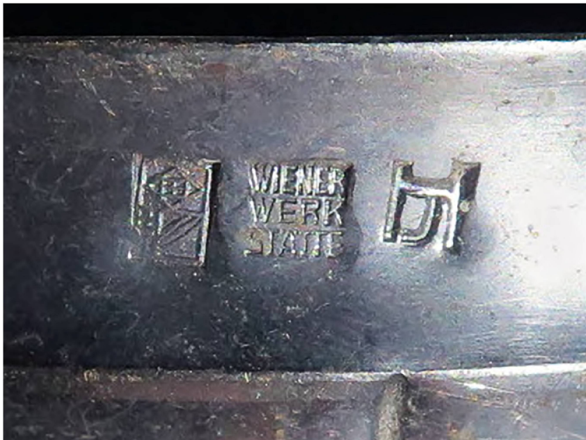
12 Détail du lustre : à gauche, poinçon de la marque déposée Wiener Werkstätte; au centre, monogramme de la Wiener Werkstätte; à droite, poinçon de Josef Hoffmann. MAH, inv. AD 3747.

Ceci amène à parler de manière plus générale de l'influence du Japon dans le mobilier de Hoffmann, dans lequel on retrouve « l'accentuation de la verticalité », « des formes épurées en lesquelles les vides l'emportent sur les pleins » 3 . Les croisillons sur l'arrière des chaises du salon (fig. 3) et ceux des jardinières basses (fig. 4) font référence au treillis, élément du répertoire décoratif asiatique qui n'apparaissait pas de façon aussi voyante dans les styles occidentaux avant l'influence du japonisme dans l'Art Nouveau. Les accoudoirs arqués de ces sièges sont également très proches de ce que l'on peut trouver sur le mobilier asiatique. Les deux lustres que le musée possède dénotent, quant à eux, une influence Jugendstil marquée, avec des lignes courbes et un décor végétal sinueux très en évidence, mais toujours avec une recherche de grande simplicité. Ces lampes sont marquées sur la face visible de leur base d'accroche du monogramme et du poinçon de la marque déposée de la Wiener Werkstätte, ainsi que du poinçon de Josef Hoffmann (fig. 12).