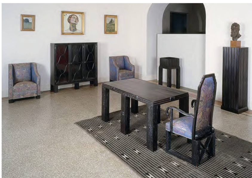
5 Exposition du mobilier Hoffmann (MAH, 2008). Grande table, chaise à bras, deux fauteuils, bibliothèque vitrée, jardinière haute, sellette. Coll. MAH.