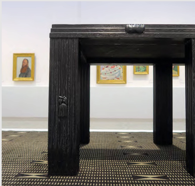
1 Détail de la grande table du salon de l'appartement de Ferdinand Hodler dans l'exposition Hodler intime (MAH, 2018). Mobilier conçu par l'architecte Josef Hoffmann.

LE MUSÉE D'ART ET D'HISTOIRE DE GENÈVE POSSÈDE PLUSIEURS PIÈCES DE MOBILIER DE L'APPARTEMENT SITUÉ AU 29, QUAI DU MONT-BLANC À GENÈVE, OÙ FERDINAND HODLER EMMÉNAGEA AVEC SA FEMME EN 1913, ET OÙ IL VIVRA JUSQU'À SA MORT EN 1918. CE MOBILIER FUT CONÇU, SUR COMMANDE DU PEINTRE, PAR L'ARCHITECTE ET DÉCORATEUR VIENNOIS JOSEF HOFFMANN (1870-1956), QUI RÉALISA AU DÉBUT DU XX e SIÈCLE PLUSIEURS AMÉNAGEMENTS INTÉRIEURS POUR DES PERSONNALITÉS ISSUES DU MONDE ARTISTIQUE OU DE LA GRANDE BOURGEOISIE.