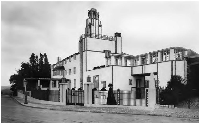
2 Palais Stoclet à Bruxelles (1904-1911).

En 1903, il fonde avec Koloman Moser une nouvelle association, la Wiener Werkstätte, qui rassemble de nombreux métiers liés à l'architecture, la décoration, la mode, le design, et où les arts appliqués viennois vont véritablement