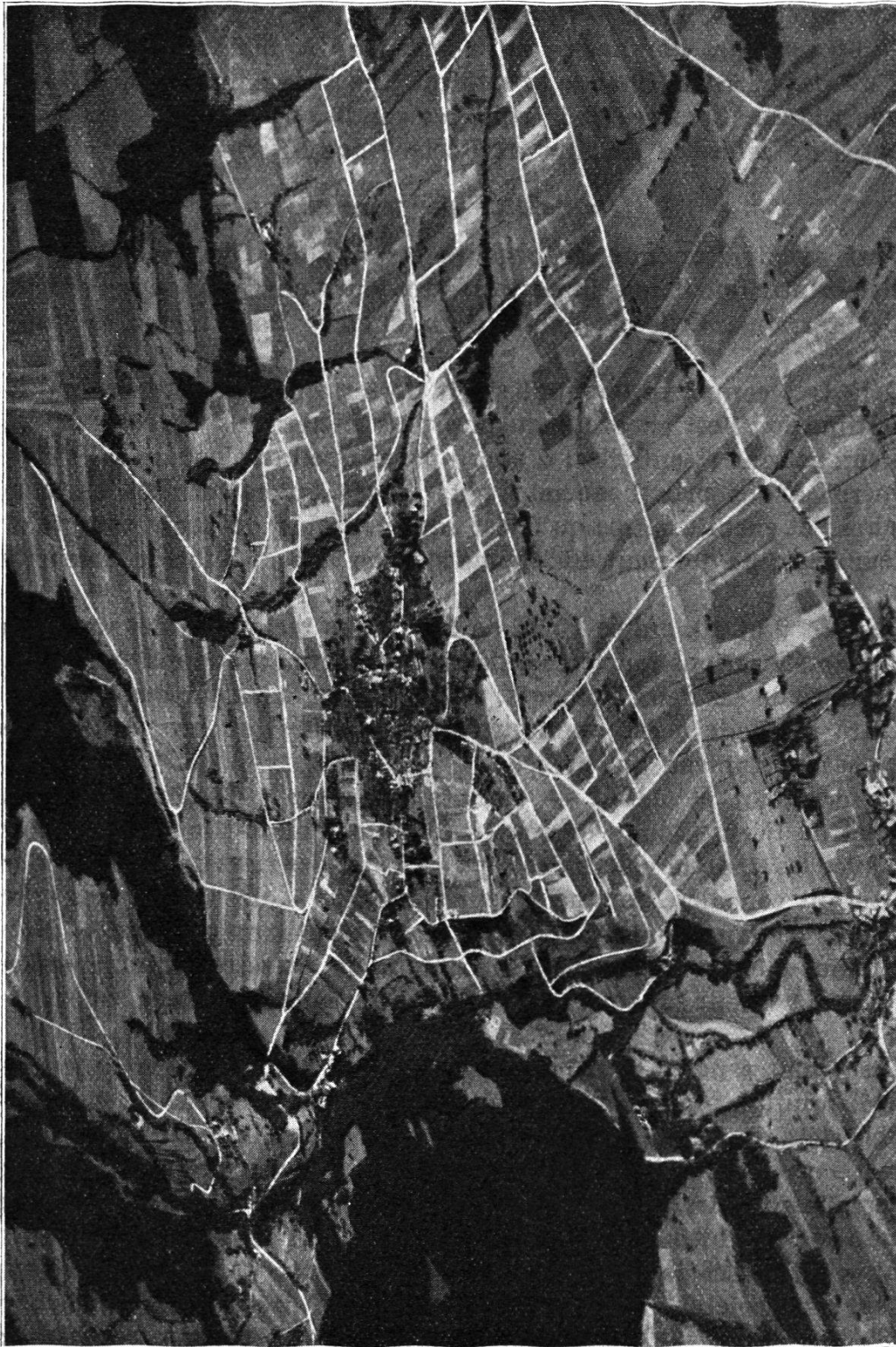
Fig. 1. Remembrement de la partie inférieure du territoire de la commune de Begnins. Vignes 81 ha. Terrains agricoles 130 ha. Réseau des chemins de dévestiture.

se constituent un peu partout: à Grandvaux, Vilette, Lutry, Villeneuve pour ne citer que ceux de Lavaux. A Blonay, le Conseil communal, sur proposition de la Municipalité, vient de voter un crédit de frs.12,000.—