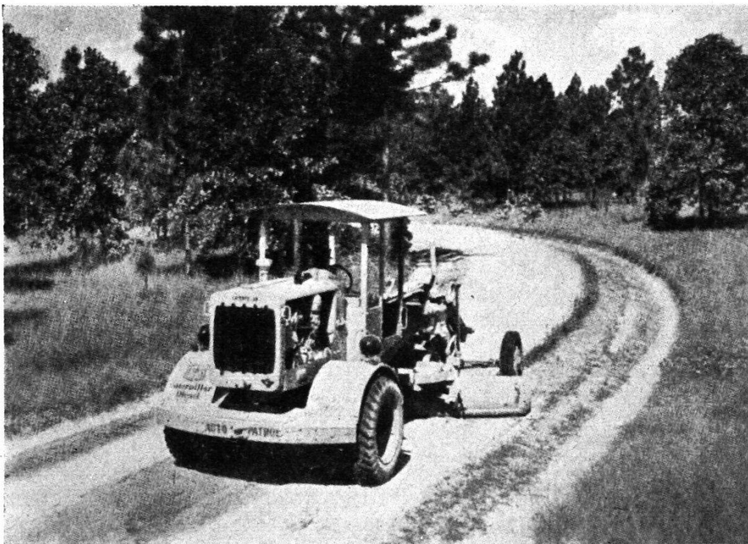
Travaux d'entretien: nettoyage des bords de la chaussée

L'empierrement en gravier stabilisé semble spécialement adapté aux chemins ruraux, tant par son coût d'établissement modeste et sa facilité d'entretien que par son adaptation au trafic mixte. Le fait que les sabots des chevaux mordent légèrement la surface du gravier n'est pas un inconvénient, au contraire. Les matériaux libérés se colmatent automatiquement sous l'effet du trafic.