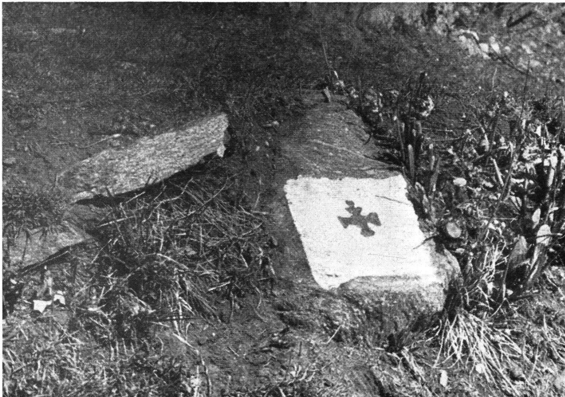
Fig. 7. Croix signalée avec du vernis blanc à l'huile

Cela n'a toutefois pas été possible pour toutes les croix; dans certains cas on a dû en signaler plusieurs excentriques: cette opération ne présentait aucune difficulté, puisqu'il s'agissait simplement de noter les éléments d'excentricité, se réduisant dans la règle, à des simples mesures de distances.