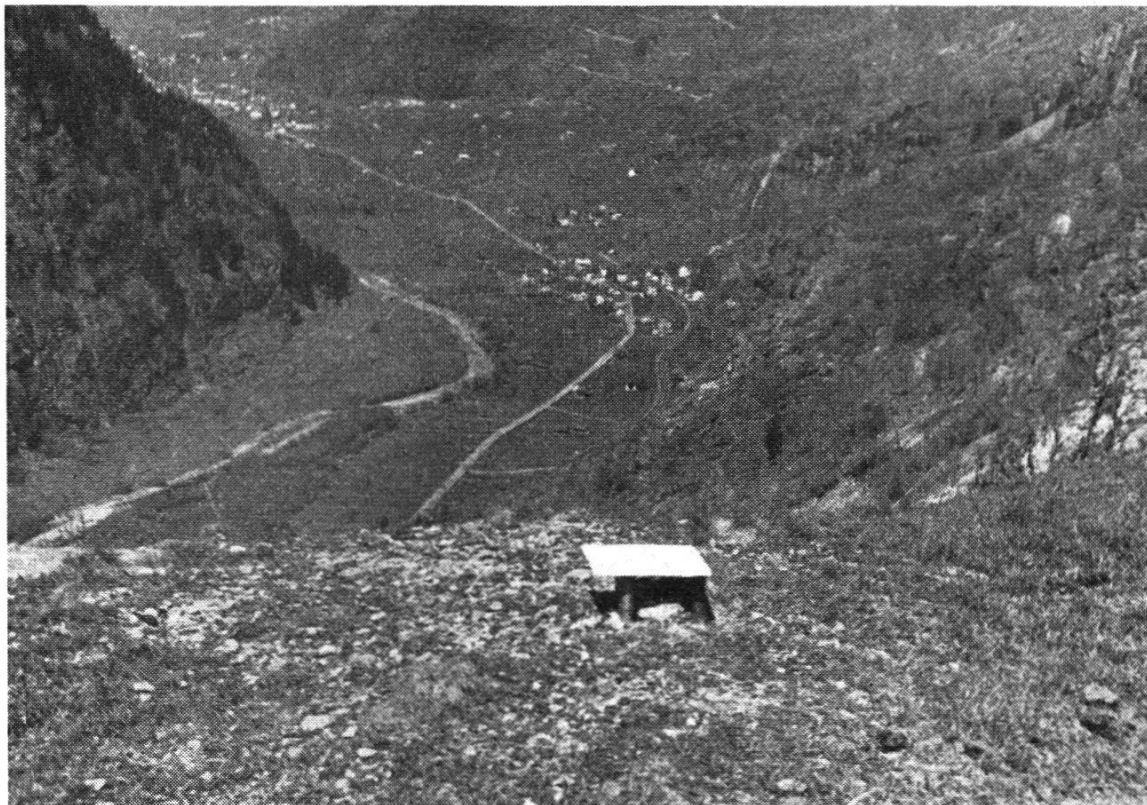
Fig. 3. Borne signalée avec carton