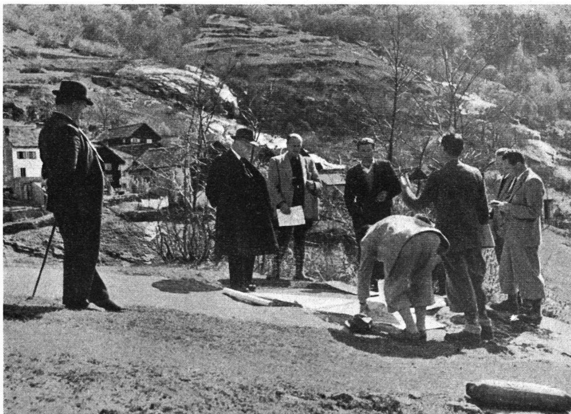
Fig. 1. Les Autorités Fédérales et Cantonales examinent sur le terrain les détails du problème

L'organisation de l'entreprise se présentait sous un aspect plus favorable que dans le cas de levés parcellaires de l'ancien état. En effet dans les mensurations cadastrales les points-limites sont en nombre réduit et ils sont bien démarqués sur le terrain. En outre il n'est plus nécessaire de faire appel à l'aide des propriétaires. Les difficultés qui peuvent se présenter sont plutôt d'ordre technique et juridique: (contenu du plan, choix des limites de culture à lever, choix de la méthode la meilleure et la plus rationnelle pour signaler les points-limites). Toutes les questions ont été l'objet de longues discussions, dans l'intention de fixer des prescriptions uniformes et concordantes avec celles qui existent en matière de mensuration cadastrale.