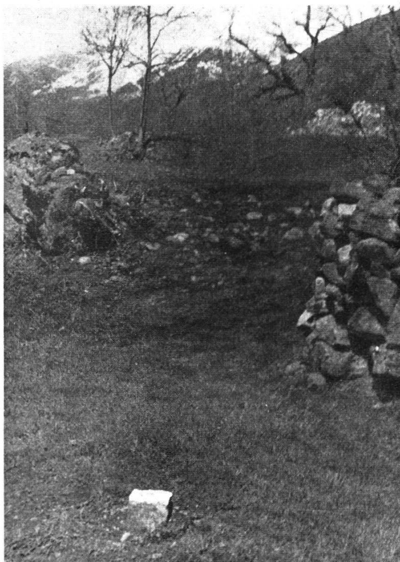
Fig. 4. Borne signalée avec du vernis blanc