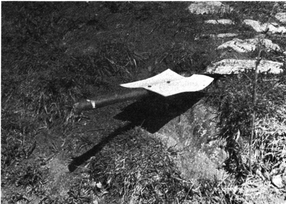
Fig. 5 et Fig. 6. Croix signalées avec carton surélevé