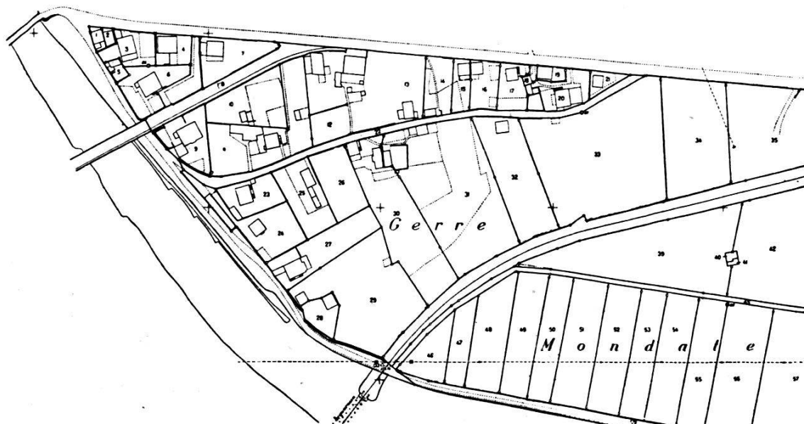
Fig. 5. Partie d'un plan original

On lut ensuite, à l'autographe, les coordonnées des mêmes points-limites, puis on les transforma en coordonnées géographiques compensées Y_a, X_a .