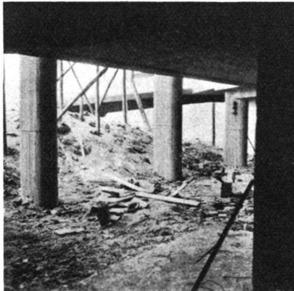
Abb. 3. Messung im Freien

Einen guten Einblick in die Verhältnisse während der Messung gewähren die drei an verschiedenen Stellen des gleichen Objekts durchgeführten Beobachtungen, die auf dem abgedruckten Formular festgehalten wurden. Die erste Messung bezieht sich auf zwei Höhenbolzen, die etwa 5 m voneinander entfernt an der Innenwand eines kleinen Raumes