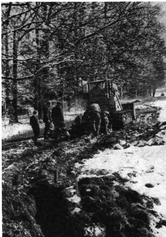
Abb. 5. Trax und Maulwurfspflug kurz nach einer Kupplungsgrube mit leichter Richtungsänderung