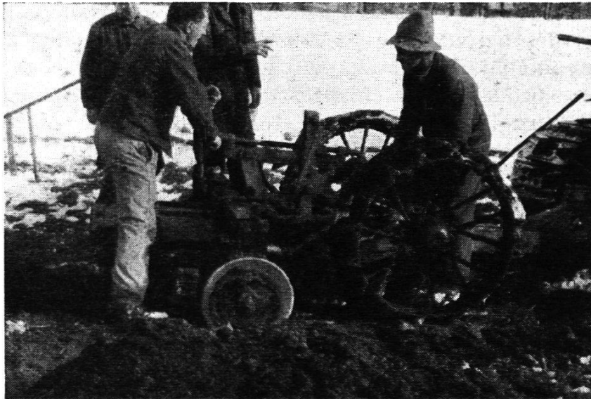
Abb. 3. Der Maulwurfspflug steht rittlings über der Kupplungsgrube