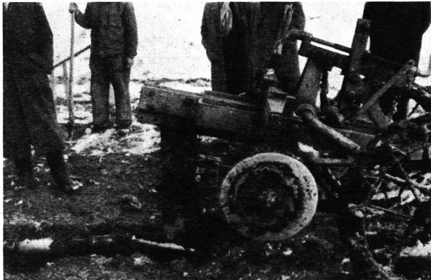
Abb. 4. Der Maulwurfspflug nach dem Ausfahren mit Vorkörper, Maulwurfskörper und Spezialkupplung

ohne Aufgrabung in einer Kurve von rund 15 m Radius zu verlegen. Auch alle übrigen Richtungsänderungen wurden durch reine Richtungsänderung mit dem Trax ausgeführt.