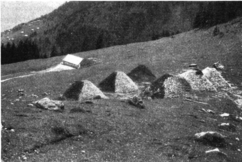
Die sechs Lawinen-Bremshöcker auf der Alp Hinteraltschen, Amden SG. Sie sind teilweise humusiert. Im Hintergrund das neue Alpbäude mit dem Lawinenschutz