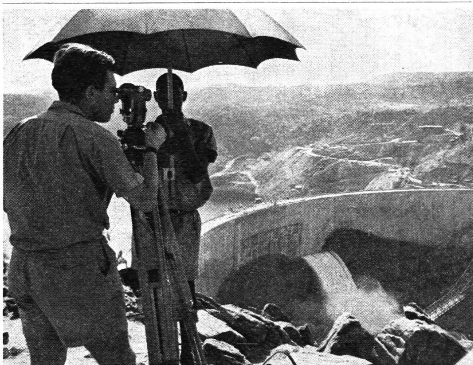
Universal-Theodolit Wild T2

Nach jahrelanger Arbeit wurde der gewaltige Kariba-Staudamm des Sambesi in Nordrhodesien fertiggestellt, womit eine erste Etappe in einem der grössten Bauprojekte der Erde beendet ist. Die mit der Planung beauftragten Ingenieure benützten für ihre Präzisionsmessungen Wild-Instrumente.