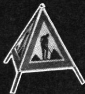
Gefahren-Faltsignale aus wetterbeständigem Plastic-Gewebe

Die Namensliste der gebräuchlichen Meßgeräte würde dieses Inserat überfüllen. So zeigen wir hier nur einen Querschnitt davon. Sie wissen ja: Bei uns finden Sie, neben der Schweiz größten Auswahl an Vermessungs-Instrumenten, das entsprechend umfangreiche Angebot aller Ausrüstung für die Vermessung.