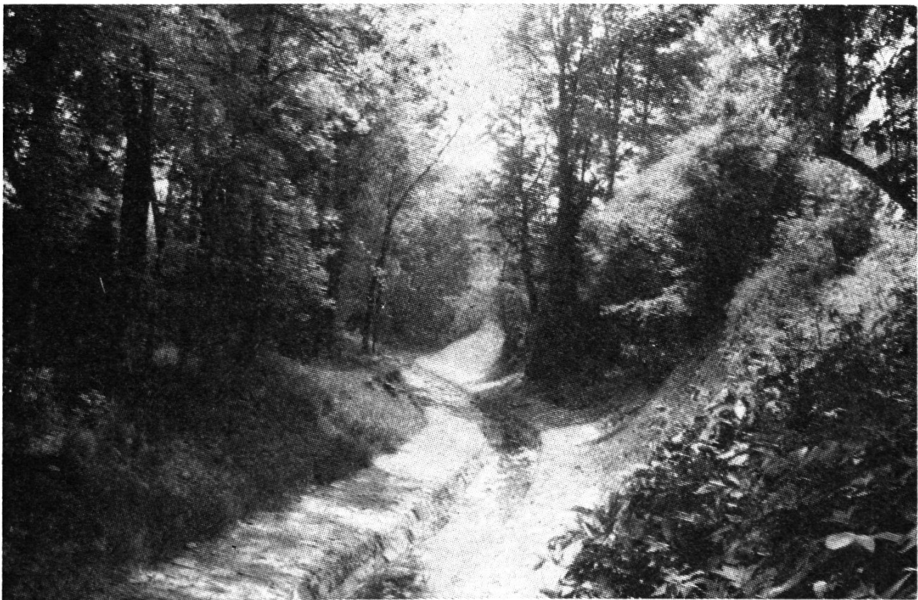
Bild 3: Korrigierter Altstätter Stadtbach, im Zuge der Melioration der Rheinebene. Früher ein unansehnliches Gerinne, eine Abfallgrube – heute ein Musterbeispiel: Natursteinpflasterung unter Schonung des alten Baumbestands.

Sicher gibt es noch zahlreiche weitere gute Beispiele. Es ist bedauerlich, daß Leute, die keinen blassen Schimmer der Regeln von Baukunst, Tiefbau, Erd- und Wasserbau, Statik und Hydraulik haben, sich zu solchen Behauptungen, wie sie unter Punkt 2 erwähnt sind, hinreißen lassen. Leider vergißt der Naturschutz, daß er mit solchen Dingen in weiten Kreisen seine Sympathie verliert. Und das im Naturschutzjahr 1970!