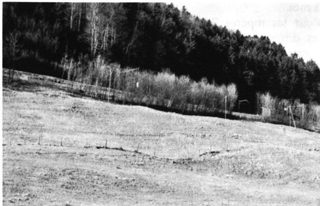
Figure 2 Vue depuis le point de référence No 1

l'épaisseur des masses en mouvement et de localiser les plans de rupture en profondeur. A la suite de ces études, le bureau mandaté présente, en août 1972, un projet de consolidation de la voie sur le tronçon le plus instable (kilomètre 17.670–kilomètre 17.770). Un mur de soutènement, supporté par des pieux et ancré dans la roche en place à l'aide de câbles, est alors construit en 1973–1974.