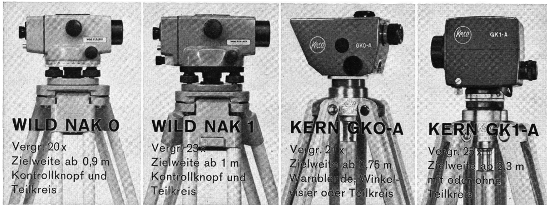
WILD NAK 0

schneller, einfacher, sicher — aufrechtes Fernrohrbild