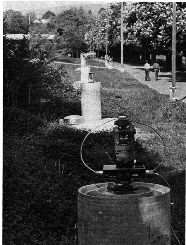
Abb. 1 Blick vom Pfeiler 0 auf die Prüfstrecke: Di 3 S auf der Zentrierplatte mit \frac{5}{8} "-Schraube für diverse Instrumentenadapter.

Nachdem aus den Anfängen mit einem Zeiss-Regelta im Jahr 1972 die elektronische Distanzmessung nun zum Standardverfahren in der Stadtvermessung von Zürich geworden ist, war es an der Zeit, eine Prüfstrecke in der Region zu installieren. Auf dem wohlbekanntem Gelände der Allmend Brunau entstand die mit Pfeilern ver-