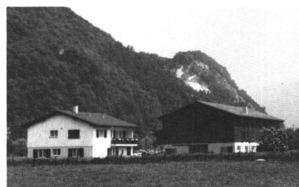
Abb. 6 Neue Hofsiedlung «Ribugg» Gemeinde Sargans, Baujahr 1976/77

In der Folge sind immer wieder erneut Projekte für dieses Werk aufgestellt und