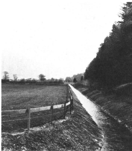
Abb. 4 Der korrigierte Saschielbach, gleichzeitig Trennungslinie zwischen Wald und Kulturland. Im Hintergrund Windschutzanlage

Bereits 1830 erstellte der bekannte Bündner Ingenieur, Strassen-, Eisenbahn- und Wasserbauer, Richard La Nicca (1794–1883), eidgenössischer Oberst, ein Projekt über die Gewässerkorrektion in der Saarebene und machte gleichzeitig einen Vorschlag, um den Rheinlauf zwischen Sargans und Ragaz in ein geordnetes Bett zu zwingen. La Nicca wollte mit seinem Vorschlag Ordnung in den Wirrwarr der verschiedenen Wasserläufe in der Saarebene bringen. Seine Arbeit blieb aber unausgeführt. Der Grundgedanke der Solidarität für ein solches Korrektionswerk war noch nicht vorhanden. Beiträge der öffentlichen Hand flossen damals noch nicht. Auch hatte der junge Kanton St. Gallen offenbar andere Probleme zu lösen, und die Bevölkerung im Sarganserland war als langjähriges Untertanenland der Grafen und später der sieben alten Orte der Eidgenossenschaft durch die Besetzung mit Truppen Napoleons, die Verheerungen der zahlreichen Waldbäche und die immer wiederkehrenden Überschwemmungen des Rheins verarmt und verängstigt. Dennoch wären Sargans und