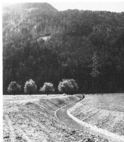
Abb. 3. Der neu ausgebaute Saschielbach