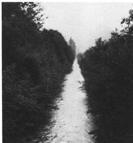
Abb. 8 Der bereits wieder eingewachsene Saarkanal. Zustand Spätsommer 1978

Die Nationalstrasse Zürich-Chur (N3 und N13) durchquert auf einem Damm in einem langgezogenen Bogen einen grossen Teil des Meliorationsgebietes und verläuft ein Stück weit parallel zur SBB-Linie Sargans-Bad Ragaz und gelangt dann, die Baumgärten von Ragaz durchquerend, an den Rhein. Die Rheinstrasse (N13) von Trübbach kommend, durchquert ebenfalls in einer Kurve einen Teil des Meliorationsgebietes und mündet oberhalb des Bahnhofes Sargans in die Nationalstrasse Zürich-Chur. Dazu kommt noch das Einmündungsbauwerk bei Castels südwestlich von Sargans. Durch den Ausbau der SBB-Linie Zürich-Chur auf Doppelspur mussten ohnehin sämtliche Niveauübergänge aufgehoben werden. Im weiteren war geplant, die Spitzkehre in Sargans für die internationalen Züge Zürich-Buchs-