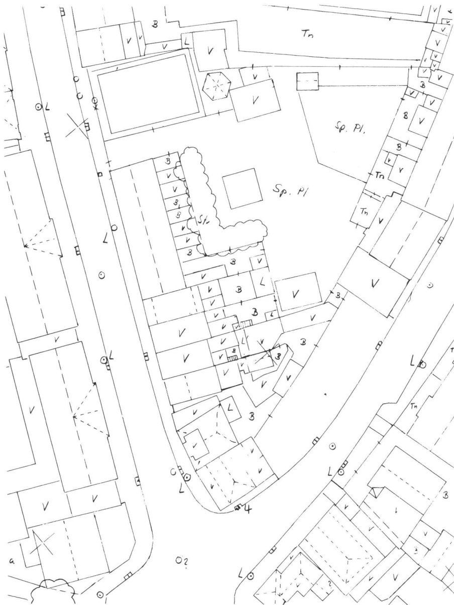
Abb. 12 Maschinenoriginal einer Auswertung mit dem Wild Aviotab TA

Auswertegerät Wild A10 Kartierungsmaßstab 1:500 Gesamtvergrößerung 5x