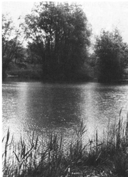
Abb. 5 Naturschutzgebiet am alten Vilterser Kiesfang

Vilters für die Ausführung dieses Korrektionswerkes gewesen. Wangs war dagegen, und Ragaz zog sich nach seiner anfänglichen Zusage wieder zurück, in Mels waren die Meinungen geteilt. Dass die Weisstanner sich nicht dafür begeistern konnten, ist verständlich. Auch mag die ungünstige Epoche von 1840–1848 mit dazu beigetragen haben, dass die Arbeiten nicht in Angriff genommen wurden. Es war die Zeit der Tagsatzungen der Freischarenzüge, des Sonderbundkrieges, die Übergangsperiode vom Staatenbund zum Bundesstaat unserer Eidgenossenschaft.