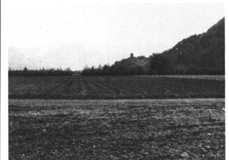
Abb. 7 Ackerbau in der zusammengelegten Flur. Blick gegen die Burgruine Freudenberg in Bad Ragaz. Im Hintergrund Windschutzpflanzung

Bis zur Inangriffnahme der nun abgeschlossenen Gesamtmelioration hat das Saarunternehmen die Kanäle, Wege und