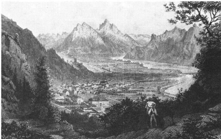
Abb. 1. Ragaz 1860. Am rechten Bildrand der noch unkorrigierte Rhein mit der Mündung der Tamina und der alten hölzernen Eisenbahnbrücke. Links hinten Sargans mit Gonzen und Älvier sowie die Wasserscheide bei Sargans/Mels.

«Seit Menschengedenken haben die Versumpfungen so zugenommen, dass dort, wo vor 40 bis 60 Jahren die fruchtbarsten Äcker und Wiesen den Eigentümer mit den schönsten Hoffnungen erfüllten und man trockenen Fusses durchwandern konnte, jetzt nichts als elendsaures Ried und Streue aus dem oft unter Wasser liegenden und versumpften Boden gewonnen wird. Dieses ist der Fall unter Wangs-Vilters und längs der Landstrasse zwischen Sargans und Vild.»