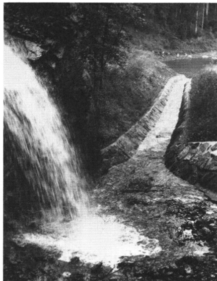
Abb. 9 Der Wasserfall der «Kleinen Saar» und deren Ableitung in einer gepflasterten Rinne in den Kiesfang des Saarfalles

Kanalböschungen am Rheindamm eine Neigung von 1 : 2 und am landseitigen Damm eine solche von 1 : 1½. Der Rheindamm sollte zu diesem Zweck durch eine 3 m breite Kiesvorschüttung verstärkt und auf die ganze Länge gegen den Kanal hin mit einer schweren Pflasterung geschützt, ferner Sohle und landseitiger Kanaldamm abgepflastert werden. Die Verlegung der Saarmündung talabwärts bedeutet die Voraussetzung für die reibungslose Entwässerung für das gesamte Meliorationsgebiet und die Verhinderung des Rückstaus bei Rheinhochwasser und die damit verbundene Überschwemmung des Kulturlandes.