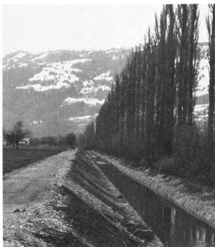
Abb 2. Der vertiefte und verbreiterte Saarkanal. Kiessohle und Natursteinpflasterung unter Schonung des linksufrigen Pappelbestandes. Neuer Parallelweg. Rechts im Bild erkennt man noch die alte Pflasterung mit kleinen Steinen und damit die Tiefe des alten Kanals. Zustand 1970

«Schlimm ist es aber auch um die Landstrasse von Sargans nach Ragaz bestellt. Bei wenig anhaltendem Wetter ist sie stets unter Wasser gesetzt. So ist sie für den Fussgänger schon unbrauchbar und ungangbar. Für Ross und Wagen aber ist sie bei Nachtzeit ganz gefährlich. Bei den Heimat- und Menschenfreunden greift noch etwas anderes ans Herz. Es stellt sich bei Mensch und Tier ein hartnäckiges und kalt abzehrendes Fieber ein. Das ehemals so gesunde und kräftige Volk leidet grosse Gefahr. Die Menschen altern und sterben vor der Zeit. Die Rossfumpung naht sich eben auch den Dörfern.» Unwillkürlich müssen wir bei der Schilderung dieser bitteren Zustände eine Parallele mit dem Linthgebiet vor seiner Korrektion ziehen. Noch in einem Bericht des Jahres 1863, den die Kommission des Saarunternehmens zuhanden der Grundbesitzer und der Regierung abgab, ist die Erinnerung an die-