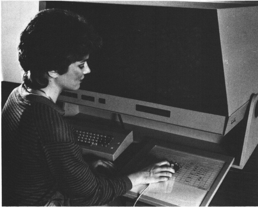
WILDMAP – graphische Arbeitsstation

Paketen mit vermessungstechnischen Operationen und graphischen Funktionen bequeme Koordinatenberechnung, graphische Bearbeitung und kartographische Editierung im interaktiven Dialog am Tischrechner mit graphischem Bildschirm.