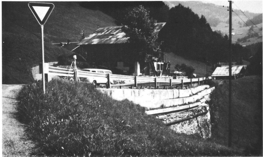
Fig. 2 Mur de soutènement enjambant la limite Est du glissement à la hauteur de Cergnat.

Il s'agit de celui de 1966, où une mesure ponctuelle à trois semaines d'intervalle a été faite par le service des routes du canton de Vaud. Le deuxième a eu lieu l'hiver passé (81-82). Il a fait l'objet