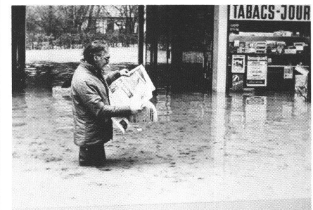
Abb. 2 Überschwemmung von Genfer Wohnquartieren anlässlich der Hochwasser der Seymaz vom 28. Januar 1979.

bestehenden natürlichen Gewässernetz oder Kanalisationsnetz absorbiert werden. Die Systeme werden überlastet und weisen sehr bald eine mangelhafte Funktion auf. Überschwemmungen mit zum Teil sehr kostspieligen oder sogar tragischen Folgen (Abb. 2) sind dann meistens das Resultat. Aber auch unter der Bodenoberfläche können durch Rückstau in Kanalisationen Schäden auftreten, so z. B. an Fundationen.