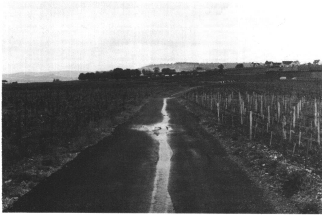
Abb.1 Mit Belag versehener Flurweg, der dank seines V-Profiles auch als Vorfluter dient.