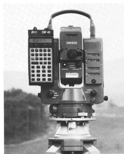
Abb.2 Unser Gerätesystem im Dienste Ihres Taschenrechners. Kern E 2/DM 503 Tachymeterkombination mit Dateninterface Kern DIF 41 und Taschenrechner HP-41C/CV

Obwohl die Elektronik heute im Theodolit nicht mehr wegzudenken ist, gilt es nach wie vor, auch die Feinmechanik der Instrumente zu perfektionieren. Ohne die mechanische Stabilität bringt auch die höchste elektronische Auflösung keine Genauigkeitssteigerung. Die im E 2 eingebaute Kugellagerstehachse hat sich im berühmten Kern DKM 2-A tausendfach bewährt und ist der eigentliche