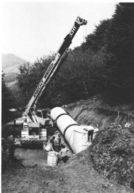
Montage des dreiteiligen Reservoirs

Das Reservoir dient der Erschliessung der neuen landwirtschaftlichen Siedlung «Asper-