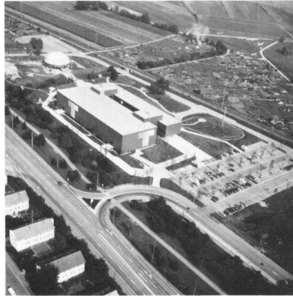
Fig.1 Vue générale des bâtiments du Technorama; au second plan, la coupole du Laboratoire de la Jeunesse.

A l'instigation de plusieurs personnalités de notre profession, notamment de l'ancien directeur de l'Office fédéral de la Topographie, Monsieur E. Huber, une surface de 150 m 2 , située dans le secteur de la physique, fut réservée à la «Mensuration». Fin octobre 1981, une première séance permit de fixer le cadre général de cette exposition, et de créer un groupe de travail avec des représentants de la Direction fédérale des mensurations, de l'Office fédéral de la Topographie, des Ecoles et des firmes Kern et Wild. Il restait 5 mois jusqu'à l'ouverture du Technorama! Il fallait faire vite. En janvier, le projet détaillé était sur pied; à fin mars, nous commençons à livrer et à monter nous-mêmes une grande partie du matériel d'exposition. Le jour de l'inauguration, le 8 mai 1982, notre secteur était l'un des