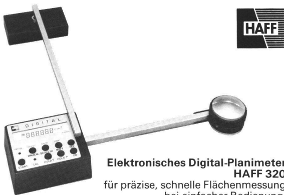
Elektronisches Digital-Planimeter HAFF 320 für präzise, schnelle Flächenmessung bei einfacher Bedienung.