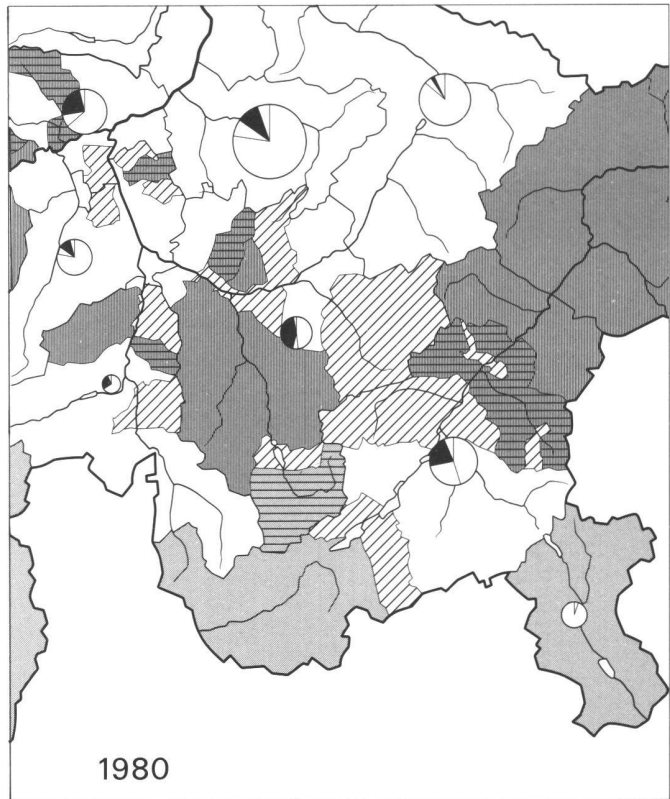
Ausschnitt aus der Tafel "Sprachen" des Atlas der Schweiz, reproduziert mit Bewilligung des Bundesamtes für Landestopographie vom 13.11.84

*viele Gastarbeiter für den Bau der Rätischen Bahn