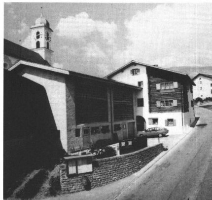
Abb. 3: Gelungene Sanierung: Umfassende Renovation eines schutzwürdigen Wohnhauses und stilgerechter Neubau der Scheune.

Der folgende Katalog zeigt Probleme auf, die sich aus dem Interesse an der Er-