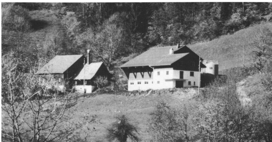
Abb. 4: Der ansprechende Neubau (rechts) berücksichtigt den Charakter dieser Juraregion (Foto: LBA Cernier).

haltung der Bauernhöfe im Dorfkern und den kommunalen Interessen an der rationalen und zeitgerechten Erschliessung des Baulandes ergeben (6,7):