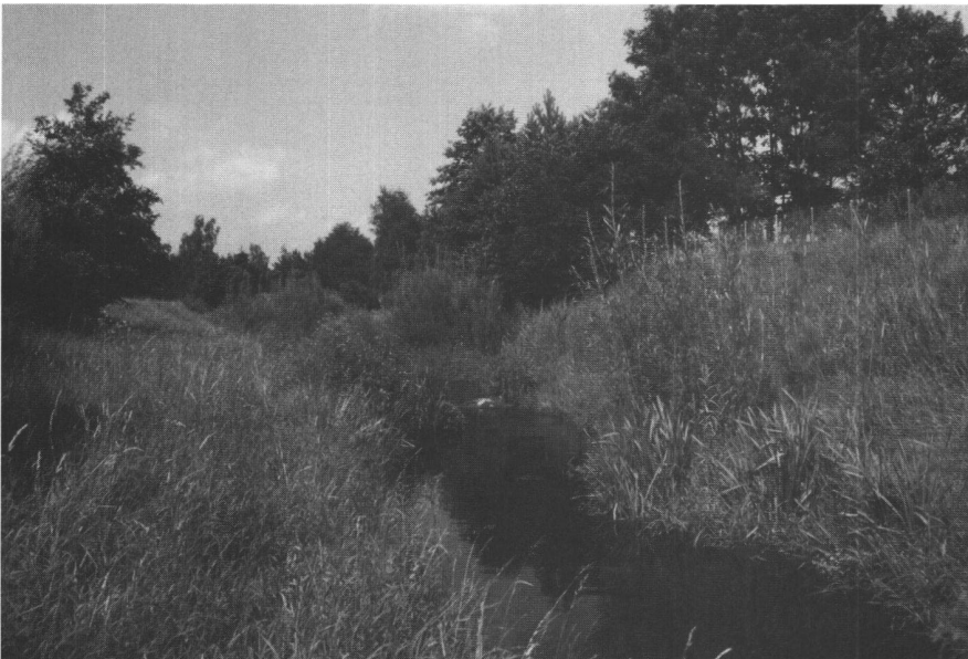
Abb. 1: Der Nefbach bei Neftenbach vor und nach der Korrektur 1985.

herigen, unbeschreiblichen sanitären Verhältnisse verbessert, für die Flüsse, Bäche und Seen begann aber damit der Leidensweg der Eutrophierung, die erst mit dem Bau von Kläranlagen modernsten Zuschnittes gestoppt und teilweise rückgängig gemacht werden konnte. Auch wenn die Verordnung von 1881 verlangte, dass «Fabrikabgänge oder andere schädliche Stoffe entweder vor ihrem Einlass in Gewässer derart gereinigt oder bei dem Einlauf durch geeignete Vorrichtungen mit so viel Wasser gemischt werden müssen, dass sie nicht mehr schädlich wirken», so war eine Reinigung von Abwässern erst durch die Anwendung moderner Technik möglich. Jahrzehntelang war dies ein Wettlauf zwischen zunehmender Verschmutzung einerseits sowie den technischen und finanziellen Möglichkeiten andererseits, der noch nicht überall zum guten Abschluss gekommen ist. Es brauchte