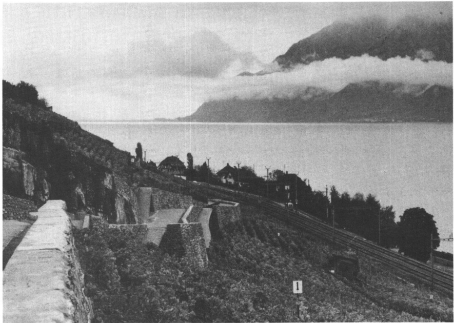
Abb. 3: Auch im Detail sorgfältig konzipierte Meliorationsstrasse in La Villette, Grandvaux, Cully VD.