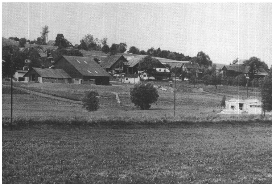
Abb. 4: Der Stall und die Scheune am Dorfrand von Herferswil, Kanton Zürich, wurden gut sowohl der Landschaft als auch der bestehenden Siedlung angepasst (Foto: W. Roelli).

merken wäre, dass der «ländliche Raum» in einem gesellschaftlichen Sinne wahrscheinlich eher eine Projektion der Städter als eine Realität ist), dann müssen die Massnahmen, die den vorgegebenen Zielen dienen, neu orientiert werden. Warum nicht die an sich bewährten Instrumente, beispielsweise die Güterzusammenlegung, zur Wiederherstellung eines naturnahen Gewässernetzes mit natürlicher Bestockung und zur Schaffung vernetzter Biotope in einer zuvor ausgeräumten Landschaft einsetzen? Ist das, was uns die Vernunft gebietet, bloss Utopie? Oder umgekehrt: Sind nicht heute Utopien realer als das Weiterfahren in alten Geleisen? Das beschleunigte Artensterben, die auch im Flachland auftretende Bodenerosion, schädliche Rückstände in Nahrungsmitteln und anderes mehr sind Symptome, die wir nicht mehr übersehen können. Gewiss, die erforderliche Änderungen im agrarpolitischen System, insbesondere die Abkoppelung der