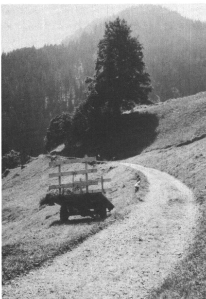
Abb. 2: Dieser Maschinenweg bei Isenfluh, Lauterbrunnen, Kanton Bern, ist sehr geschickt der Landschaft angepasst worden.

Das alles sind aber nur einige grundsätzliche Einwände gegen das Konzept einer wissenschaftlich-technischen Objektivität. Die menschlichen Imponderabilien und irrationalen Widersprüche kommen hinzu. «Den Letzten beißen die Hunde» lautet eine volkstümliche Redeweise, hinter der mehr steckt, als man gemeinhin annimmt. Wir neigen dazu, nur die Folgen im letzten Glied einer Ursachenkette korrigierend anzugehen, nicht aber die auslösenden Momente und ihre gegenseitige Verknüpfung. Beim Hochwasserschutz war dies viele Jahrzehnte weitgehend der Fall, und eine Wende zeichnet sich erst in jüngster Vergangenheit ab. Andere Beispiele sind der Strassenbau oder nicht integral konzipierte Meliorationen. Unerwünschte Begleiterscheinungen, die populär aber letztlich nicht zu unrecht unter den Schlagworten «Betonierung» und «Geometrisierung» zusammengefasst werden, sind weitgehend die Folge eines gesellschaftlichen Verhaltens, das den «Fünfer und das Weggli» anstrebt und dabei – so möchte man beifügen – im Begriffe ist, beides zu verlieren, nämlich die wirtschaftliche Prosperität und die natürlichen Lebensgrundlagen.