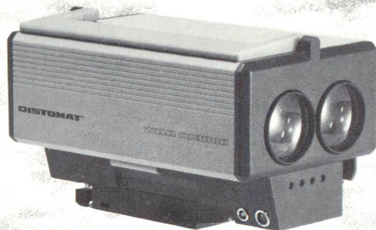
DI3000 DIOR 3002