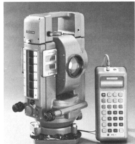
Abb. 1 zeigt die Totalstation ET-1 von Topcon. Sie ist das Flaggschiff einer kompletten Gerätefamilie für die computerunterstützte und millimetergenaue Vermessung. Reichweiten von bis zu 2600 m, elektronische Winkelmessung, berührungsfreie Bedienung, automatische Kompensation der Erdkrümmung und externe Datenspeicher sind nur einige der vielen Vorteile.

Das Vertriebsprogramm wird abgerundet durch Topcon-Universal-Messmikroskope und durch Videobild-Verarbeitungssysteme der Marke Viper von Gesotec.