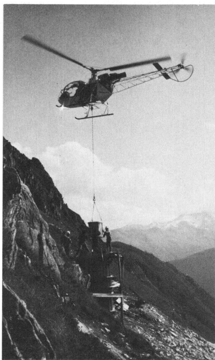
Abb. 14: 400-kV-Mast, Lukmanierleitung, Fundamentbau