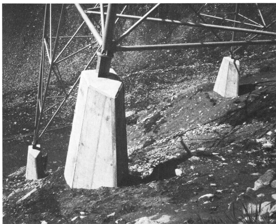
Abb. 15: 400-kV-Mast, Lukmanierleitung, Fundamente mit Lawinenkeil

eliminiert eine Menge Fehlerquellen und produziert Zeichnungen und Ergebnislisten in standardisierter Form. Das Material für eine projektierte Freileitung kann auf diese Weise präzise und rasch ermittelt werden.