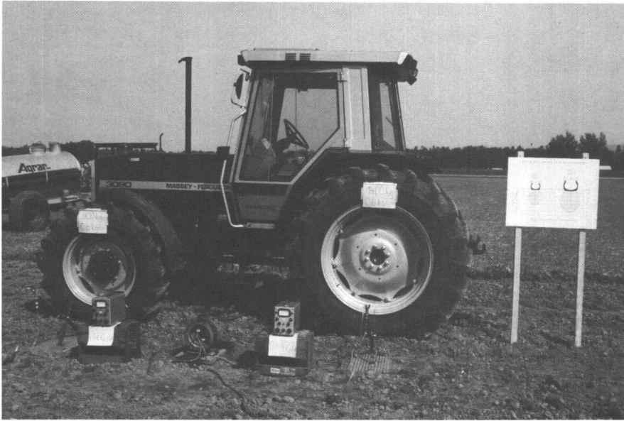
Abb. 1: Messung des Druckabbaus in 30 cm Tiefe bei unterschiedlicher Radlast und bei gleichem spezifischem Bodendruck (Kontaktflächendruck). Beispiel: