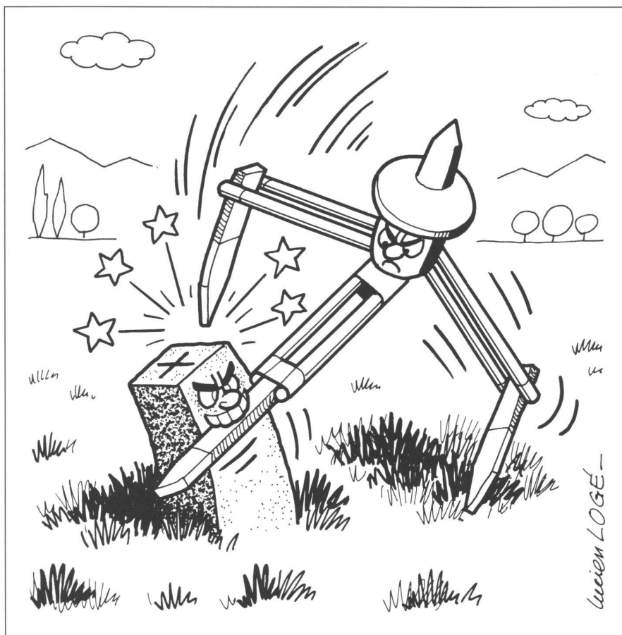
Une sorte de concurrence entre la borne géodésique et le récepteur GPS.

ment, sans aucun rattachement à des points connus? La réponse est positive, mais avec une faible précision d'une dizaine de mètres, car la mesure d'un seul récepteur est entachée d'erreurs dues à la mauvaise connaissance de la trajectoire du satellite, du géoïde et des corrections de propagation.