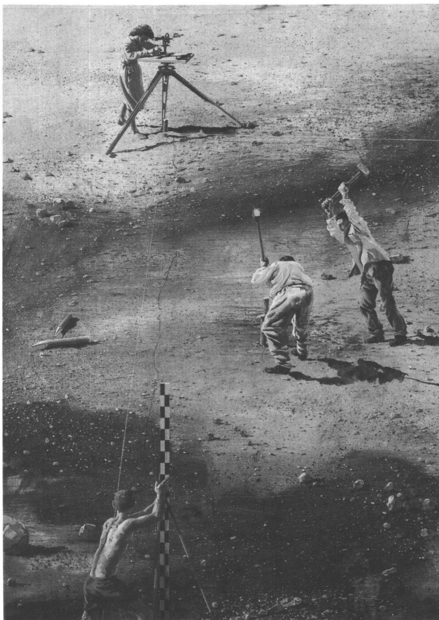
Fig. 4: Hans Erni: «La transformation du désert» (1945; musée Hans-Erni, Lucerne). En période de guerre ou de crise, la mise en valeur de nouvelles terre pour l'agriculture prend beaucoup d'importance. Mais l'appropriation de la nature par l'homme se veut aussi facteur de civilisation.

Au début du 19e siècle, d'abord en Suisse romande, puis en d'autres régions de Suisse, de nouvelles mensurations permettent la création des plans de commune à grande échelle. Ces plans cadastraux servent à la restitution fidèle de l'état de la propriété foncière, aux besoins militaires, à l'administration fiscale, à l'urbanisme et aux constructions. Les mensurations techniques et industrielles jouent aussi un rôle important dans le développement économique de notre pays; que l'on songe par exemple à l'implantation des voies de chemin de fer et des grands tunnels alpins.