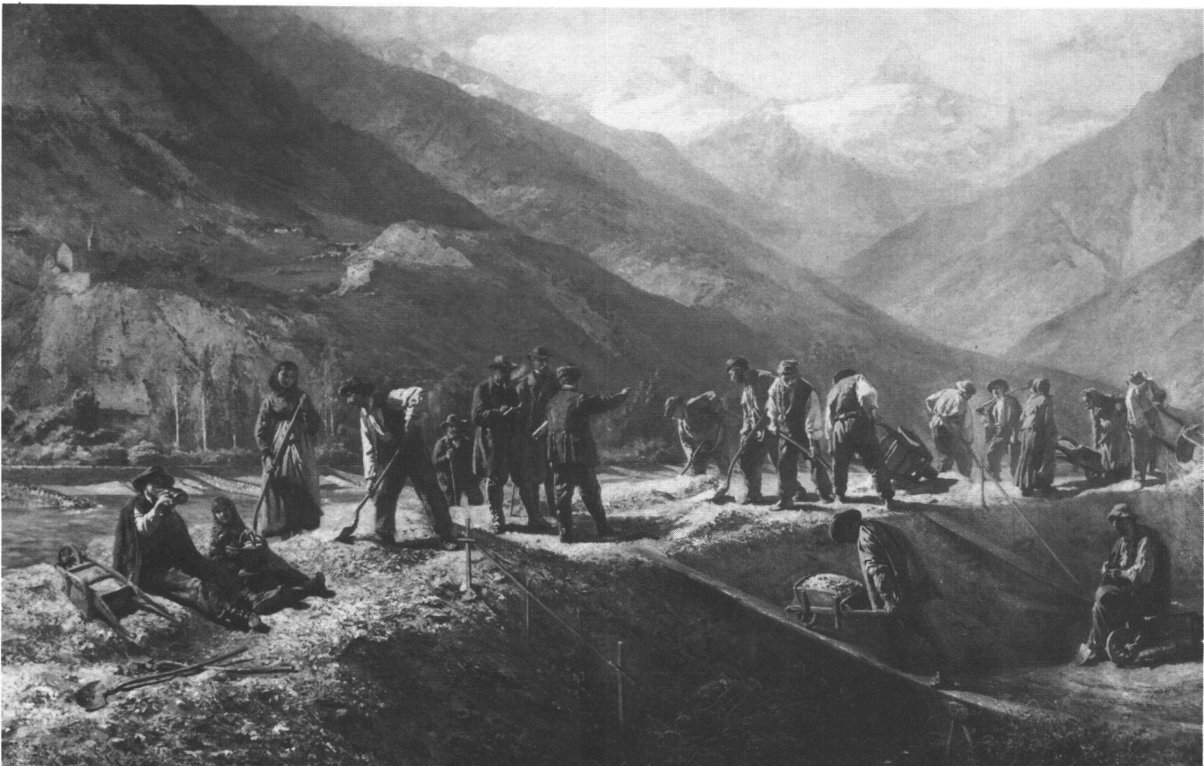
Fig. 2: Raphaël Ritz: «Correction du Rhône près de Rarogne» (1888, Musées cantonaux du Valais). Les grands fleuves de Suisse ont tous été endigués au 18e et au 19e siècle afin de protéger les terres avoisinantes contre les crues périodiques.

En Europe centrale, il apparaît dès la Renaissance: avec l'essor des sciences naturelles et du commerce, on développe les techniques agricoles et les améliorations foncières. La construction des villes s'appuie désormais sur des conceptions rationnelles; citons René Descartes (Discours de la Méthode, 1637):