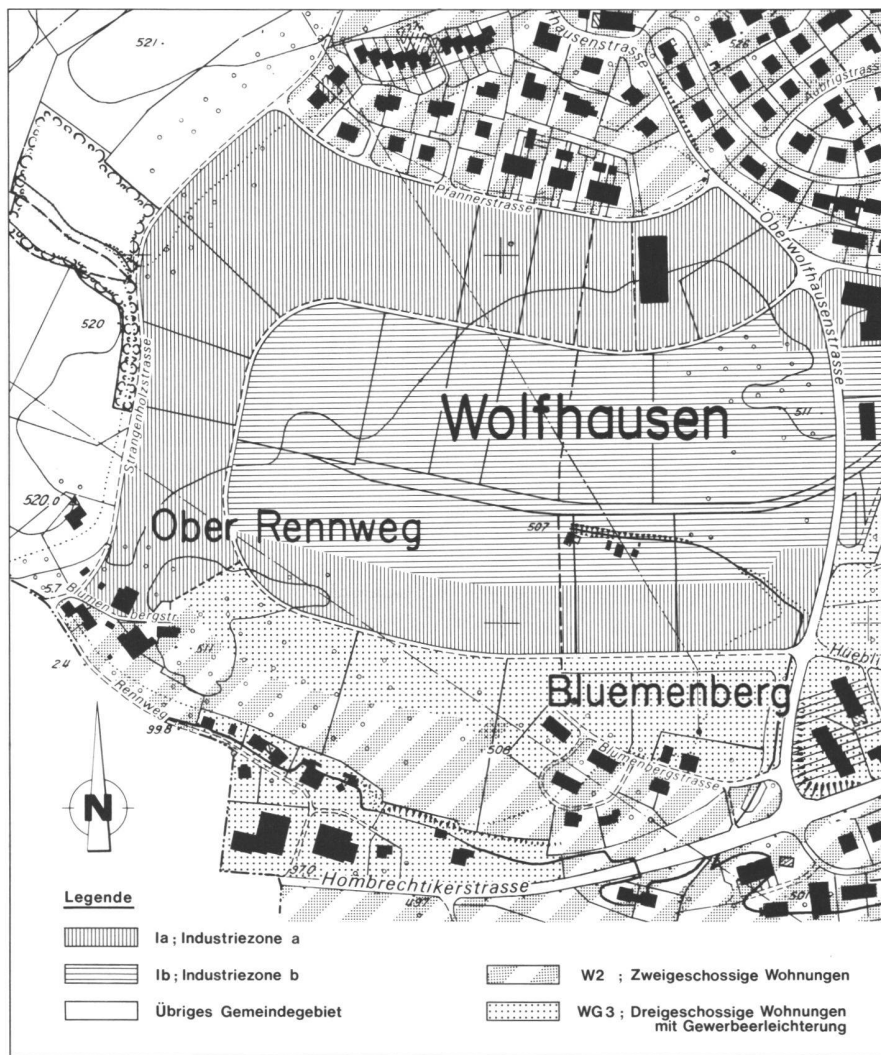
Abb. 2: Alte Zonenordnung. Genehmigter Quartierplan 1979.

Hauptziel der Studie ist es, die Durchführbarkeit einer Revision des rechtsgültigen Quartierplans, den formellen Verfahrensweg und die Lösungsmöglichkeiten skizzenartig aufzuzeigen.