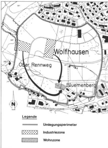
Abb. 4: Eigentümer mit Tauschvertrag. Industriezone – Wohnzone.

Gesuch um Umzonung der bezeichneten Parzelle von der Bauzone in die Landwirtschaftszone (siehe Abb. 3) und ein Entschädigungsverzicht unter dem Vorbehalt, dass die aufgelaufenen Quartierplanungskosten für die auszuzonenden Flächen anderweitig übernommen werden.