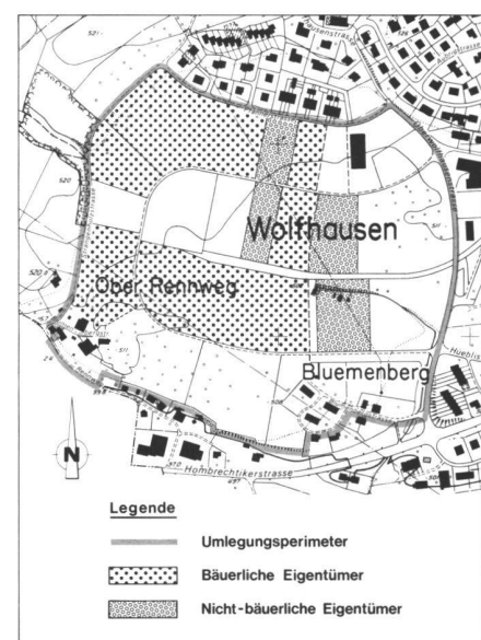
Abb. 3: Beizugsgebiet Entflechtungs-umlegung. Auszonungswillige Eigentümer mit Entschädigungsverzicht.

Für alle diese Grundstücke der beiden genannten Gruppen wurden schriftliche Erklärungen eingeholt. Diese beinhalten das