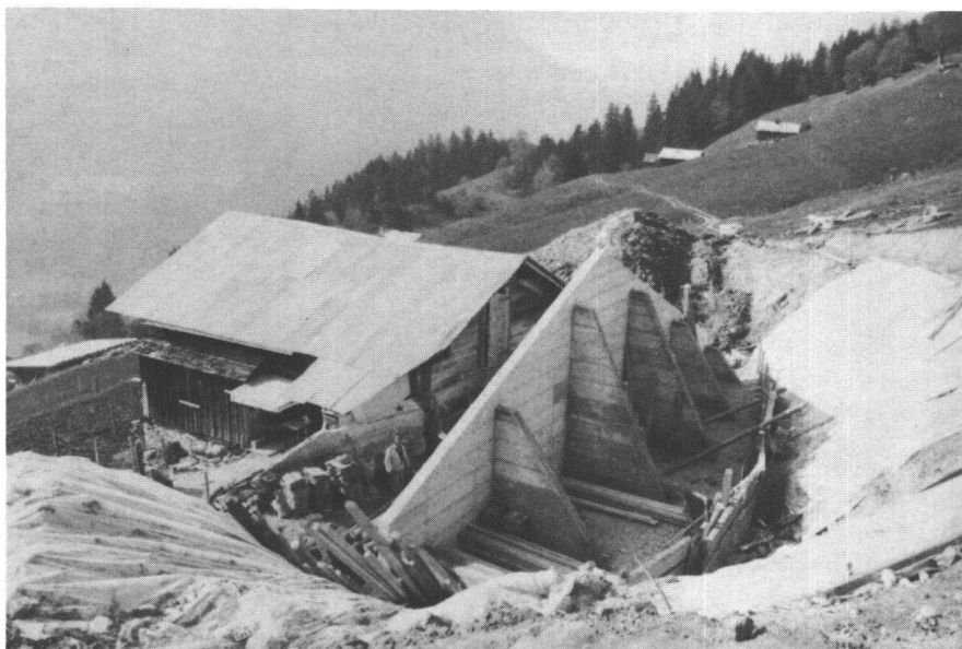
Fig. 2: Fort de protection d'un chalet situé dans un couloir d'avalanche.

tion des chapitres cadastraux particuliers à la région que sont les indivisions et les joux-à-croître.