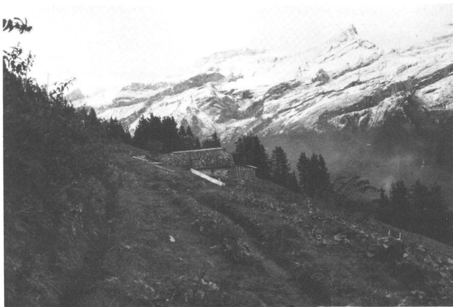
Fig. 4: Certains accès utilisés durant la belle saison sont dangereux et mal adaptés.

Pour mener à bien son étude du réseau de chemins, la Commission a associé à ses investigations des membres de la Municipalité et des agriculteurs concernés pour les dessertes étudiées. Dans la mesure du possible, le tracé des chemins peu fréquentés ou situés en altitude a été maintenu moyennant réfection. Le réseau est construit sur trois axes principaux et sur des dessertes secondaires qui per-