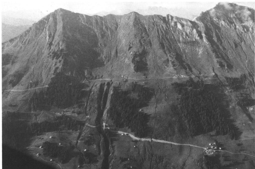
Fig. 1: Un périmètre vaste et accidenté.

Parallèlement à ce rafraîchissement de l'ancien état de propriété, la Commission de classification a dû s'atteler à la liquida-