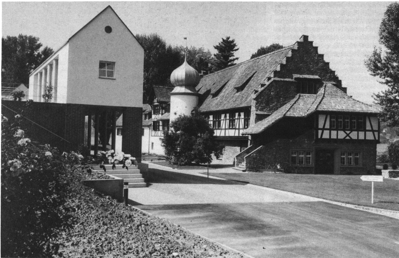
Abb. 4: Feldbachareal Steckborn – In den achtziger Jahren wurden die alten Fabrikhallen abgerissen und mit Hilfe der öffentlichen Hand eine Tagungsstätte und ein kulturelles Zentrum geschaffen (Bild 1986). Erhalten blieb über die ganze Zeit der Turm mit Zwiebelkuppel.

Die unter Napoleons Protektorat im neuen Rheinbund zusammengeschlossenen Staaten traten sofort aus dem Regensburger Reichstag aus. Kaiser Franz II. legte noch im gleichen Jahr 1806 die deutsche Kaiserkrone nieder, nachdem er als Franz I. schon zwei Jahre zuvor den Titel eines Kaisers von Österreich angenommen hatte.