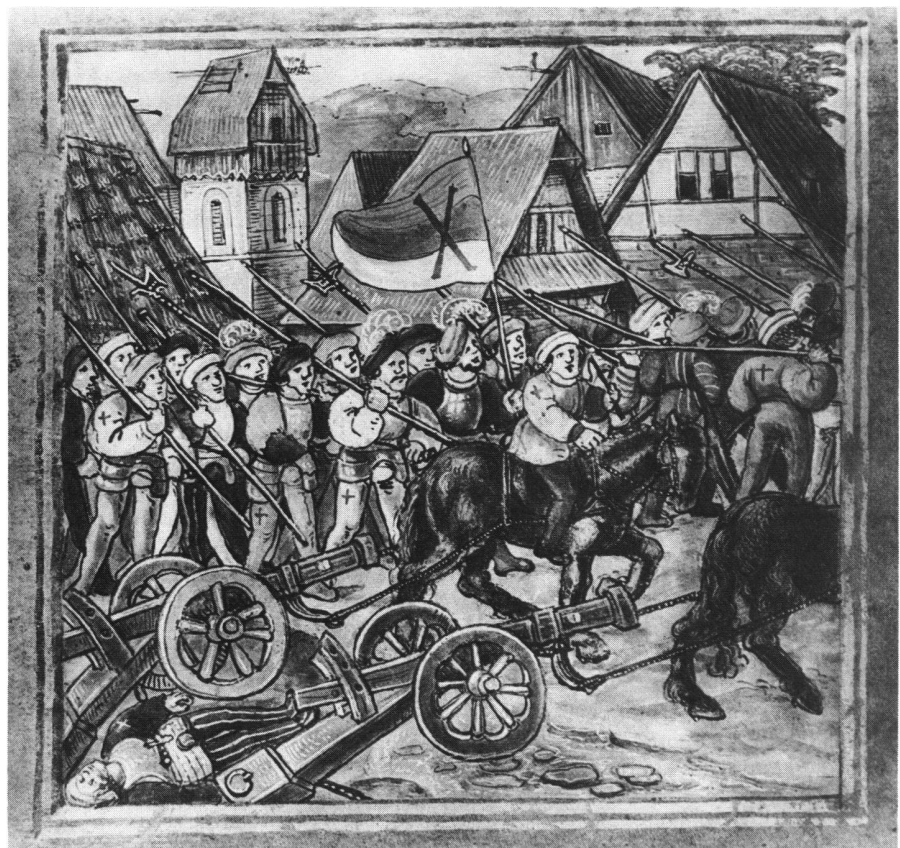
Abb. 1: Schwabenkrieg – Die Schwaben ziehen 1499 aus Ermatingen zwei eroberte Feldschlangen ab. Miniatur aus der Luzerner Chronik Schilling, 1513.

Es gehört nun zu den Unberechenbarkeiten der Geschichte, dass Gallus, der ja den Verkehr floh, mit seiner Klausnerzelle hoch über dem See den Grundstein zur heute grössten Stadt der Nordostschweiz legte. Schon zu Lebzeiten sammelten sich Jünger um ihn, und nach seinem Tode wurde sein Grab zum Wallfahrtsort. Eine Klostersgemeinschaft entstand, welche sich unter Abt Otmar der Benediktinerregel unterstellte. Wiewohl die Ordensregel des heiligen Benedikt den Jüngern empfahl, sich in entlegenen Gegenden niederzulassen, bewirkte der Zustrom der Pilger doch, dass sich vor den Klostertoren Handwerker, Händler und Gastwirte niederliessen, die mit der Zeit eine politische Selbstverwaltung anstrebten. Der Fürst-