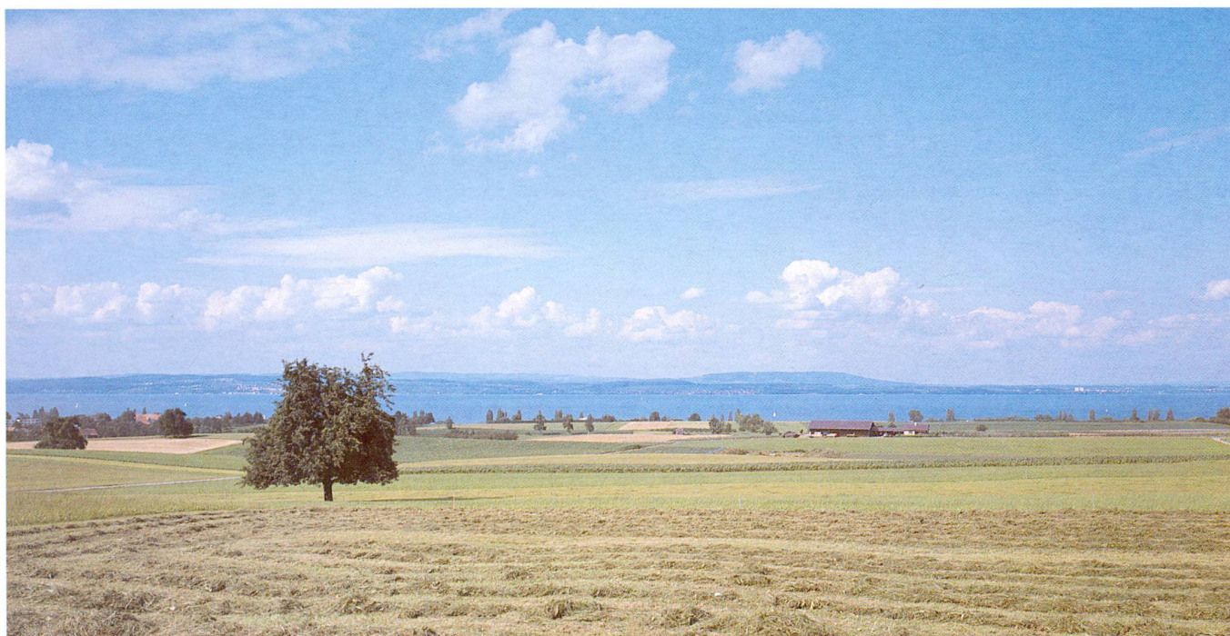
Abb. 3: Weite am Bodensee – Fruchtbares und intensiv genutztes Kulturland bei Landschlacht. Am deutschen Ufer Meersburg, Immenstaad und Friedrichshafen.

tersee nur noch Ordnungsmassnahmen getroffen und am Obersee nur noch wenige Anlagen gebaut werden dürfen. Dies hat dazu geführt, dass viele Hafengebühren fallengelassen werden mussten und Anlagen für Ordnungsmassnahmen oder auch die wenigen neuen Anlagen nur an geeigneten Stellen gebaut werden dürfen.