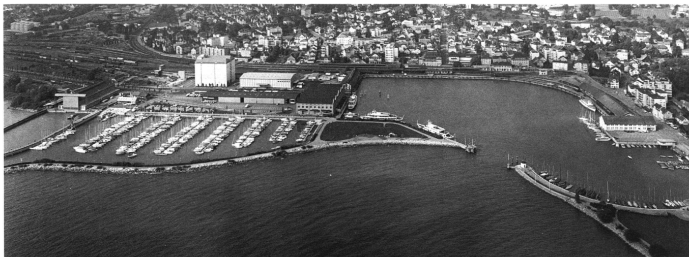
Abb. 2: Nutzungskonflikte – Auf engstem Raum Besiedlung, Verkehr, Erholung und Natur. Romanshorn mit dem neuen Dienstleistungszentrum und dem vorgelagerten Sportshafen.

gegeben. Anpassungen von Ortsplanungen sind somit ohne Änderung des kantonalen Richtplans möglich. Im kantonalen Richtplan ist ein Zusammenwirken von übergeordneter Planung und Gemeindeplanung zu erkennen. Dies entspricht unserer Planungsauffassung, denn wir wollen ein Zusammenspiel von unten nach oben und umgekehrt. Weiter ist eine kartennässige Festlegung möglich, was ein grosser Vorteil für die Handhabung des kantonalen Richtplans ist. Wohl ändern die Ortsplanungen laufend, aber im Sinne eines Protokolls des Koordinationsstandes zu einem bestimmten Zeitpunkt erfüllt der Richtplan seine Aufgabe.