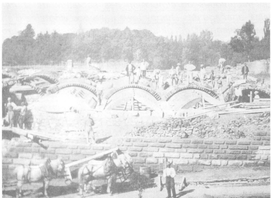
Fig. 3: Construction du réservoir de Montalègre (1868).

La marge de manœuvre des communes s'est rétrécie au fur et à mesure que le Canton, préoccupé par la nécessité d'assurer une répartition équitable des ressources en eau face à une demande sans cesse croissante, multipliait ses interven-