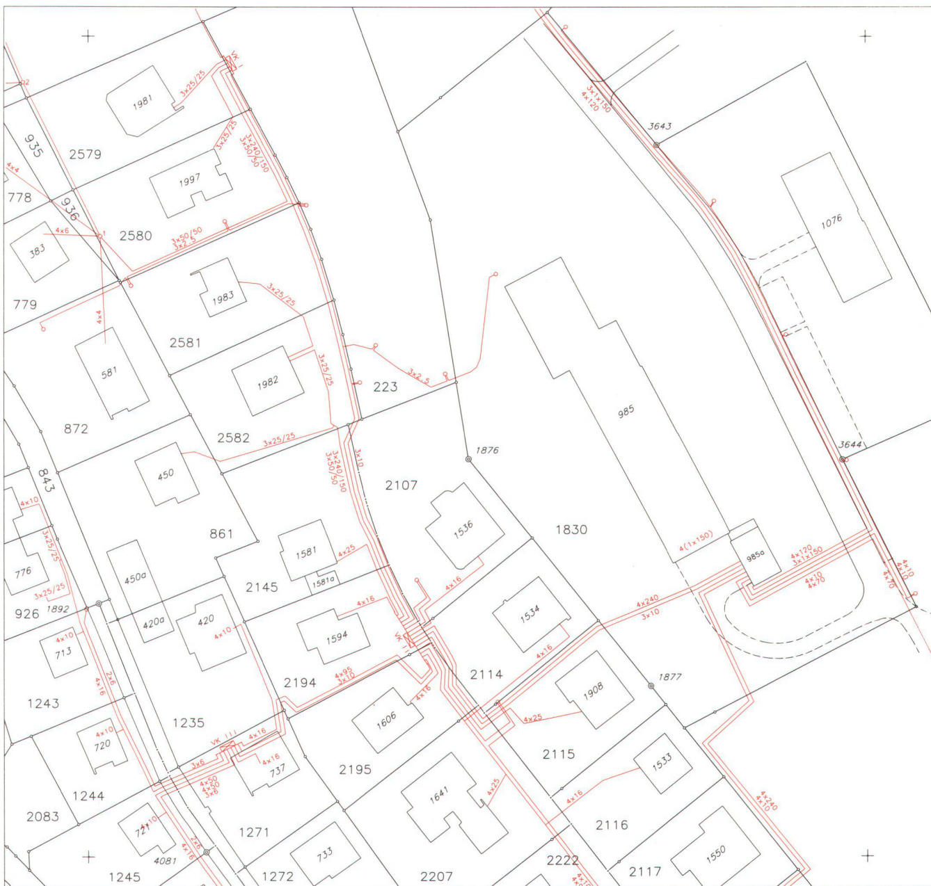
Abb. 3: Ortsnetzplan (Massstab 1 : 1000, 1 : 2000).

Im Ortsnetzplan wird das Verteilnetz und das Ortsnetz (Hochspannungs-, Mittelspannungs- und Niederspannungsnetz) dargestellt. Das Hauptgewicht hat in diesem Planwerk die Darstellung des Ortsnetzes, die Verteilung der Niederspannung ab Transformatorstation bis zum Hausanschlusskasten.