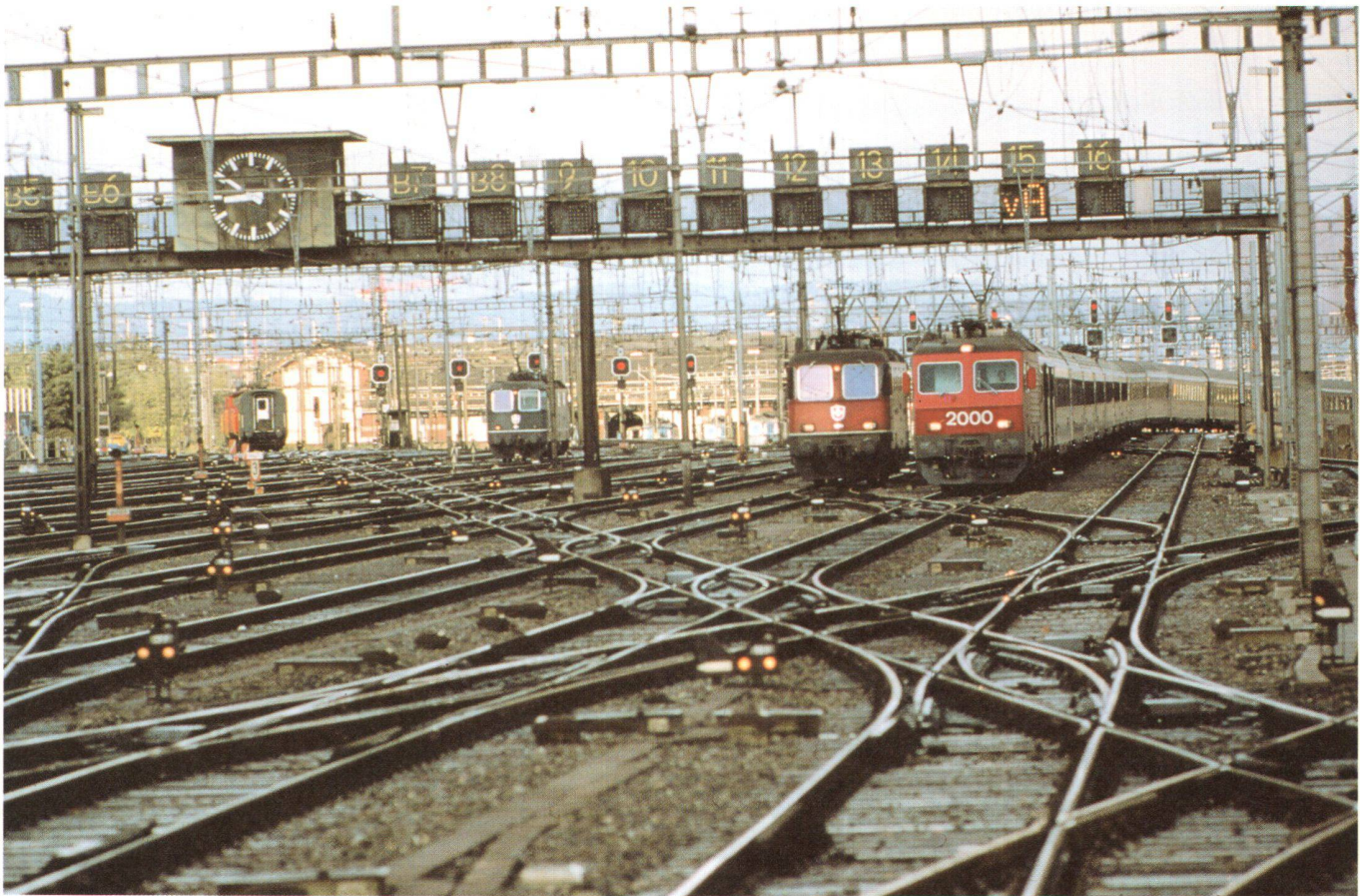
Abb. 1: Gleisanlage.