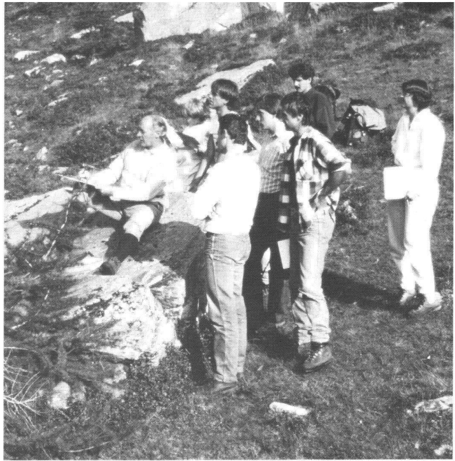
Abb. 5: Mit Studenten beim topographischen Feldzeichnen auf der Alpe Veglia, September 1987

Deine Lehrverpflichtungen an der ETH sind überaus gross, und nicht nur diese. Daneben fordert die heutige Hochschule noch unendlich viel anderes. Es sind Dein Pflichtbewusstsein und Deine hohe Achtung vor dem interessierten Studierenden, die Dich nur in äussersten Notfällen Deine Stunden versäumen lassen. Vorlesungen können dabei bekanntlich dem Fach Kartogra-