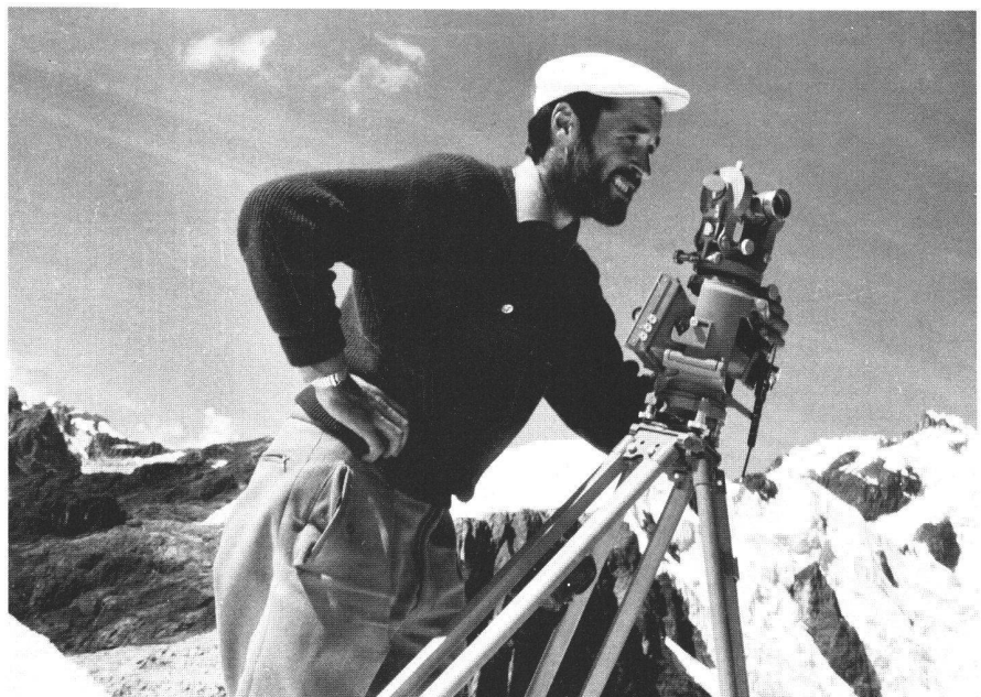
Abb. 6: Topograph in den Peruanischen Anden 1959