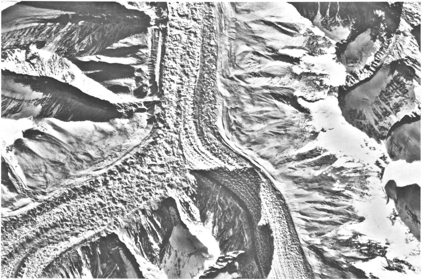
Fig. 1: Photographie aérienne (fragment), environ 1:35 000, Swissair Photo + Vermessungen AG