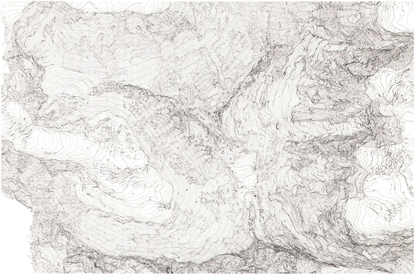
Fig. 3: Réduction de la restitution originale 1:10 000 à l'échelle de la carte 1:50 000 (partie sommitale du Mont Everest)