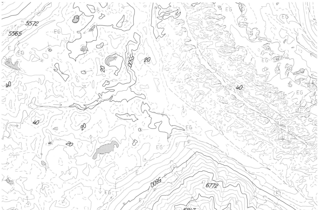
Fig. 2: Restitution photogrammétrique 1:10 000, Swissair Photo + Vermessungen AG