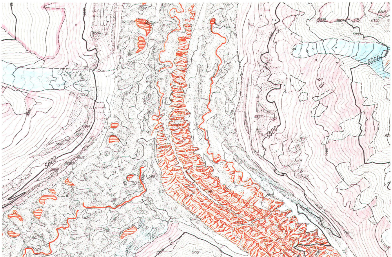
Fig. 4: Rédaction au 1:20 000 (Office fédéral de topographie)