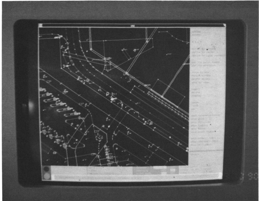
Abb. 3: Ein graphischer Plan mit INFOCAM.

Seit den 70er Jahren wird beim MD der Forschung und Entwicklung auf vielen Gebieten der analytischen Photogrammetrie, der Vermessung mit GPS und der Fernerkundung grosse Aufmerksamkeit geschenkt, teilweise auch in Zusammenarbeit mit den Instrumenten- und Software-Herstellern. Ebenso werden Überlegungen angestellt, wie die relationale Datenbank ORACLE mit RDBMS (Relationales Datenbank Management System) im vernetzten System der DSR 15 und INFOCAM nutzbringend eingeführt werden