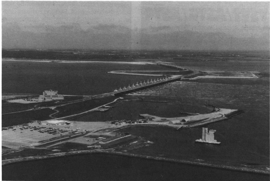
Abb. 1: Der grosse Pfeilerdamm in der Mündung der Oosterschelde.

Der Rijkswaterstaat RWS ist die grösste Abteilung im Ministerium für Transport und öffentliche Bauten der Niederlande. Er ist verantwortlich für den Schutz des Landes vor den Gewalten des Meeres durch Deiche, Dünen und Sturmflutwehre und sorgt dafür, dass alle Teile des Landes erreichbar und bewohnbar sind. Dies erfordert eine enorme Infrastruktur mit Strassen, Kanälen, Docks, Flughäfen usw. (Die Eisenbahnen unterstehen einer eigenen Abteilung). Dem RWS obliegt auch die Verwaltung aller Gewässer wie Seen, Flüsse und Mündungsgebiete. Zum Erfüllen dieser vielfältigen Aufgaben benötigt er laufend ortsspezifische, d.h. geographische Informationen. Der Vermessungsdienst des Rijkswaterstaat, der «Meetkundige Dienst» (MD) in Delft, liefert den Planungs- und Ingenieurabteilungen diese geographischen und thematischen Informationen in der Form von Karten und Plänen, topographischen Datenbanken, Profilen, digitalen Geländemodellen usw. Dazu bedient er sich modernster Technologien, einschliesslich GPS (Global Positioning System), Flug- und Satellitenaufnahmen, analytischer Photo-