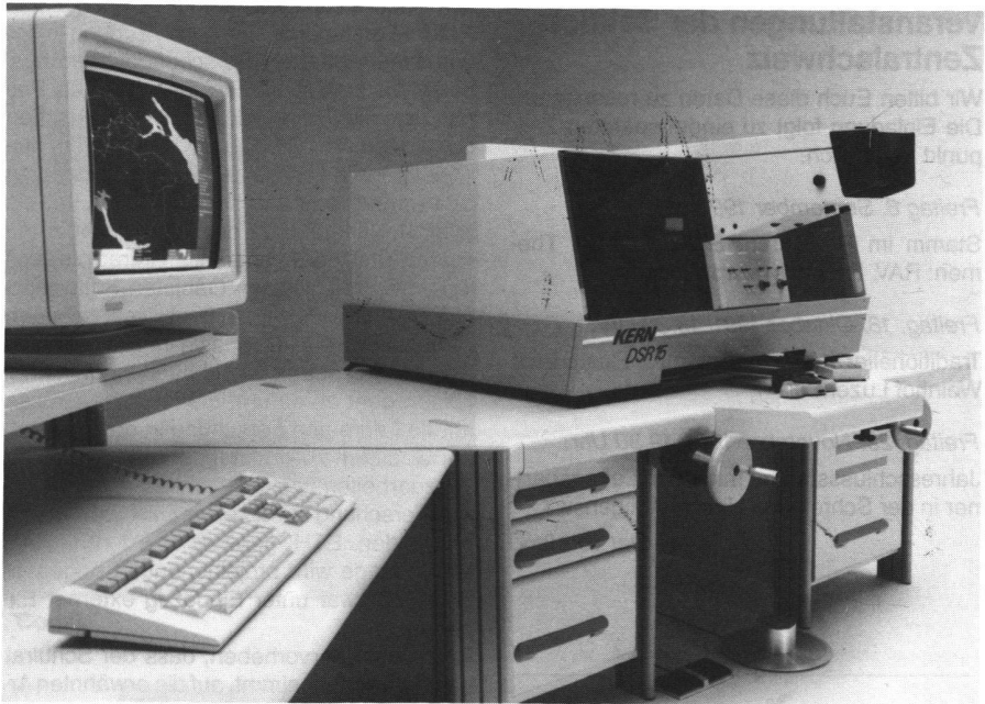
Abb. 2: DSR 15 / INFOCAM.

grammetrie und INFOCAM. Der MD ist den anderen Abteilungen zudem mit Rat und Tat bei Deformationsmessungen, Absteckungen usw. behilflich.