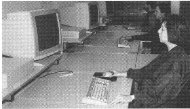
Landinformationssystem: Arbeitsplätze LEICA INFOCAM.