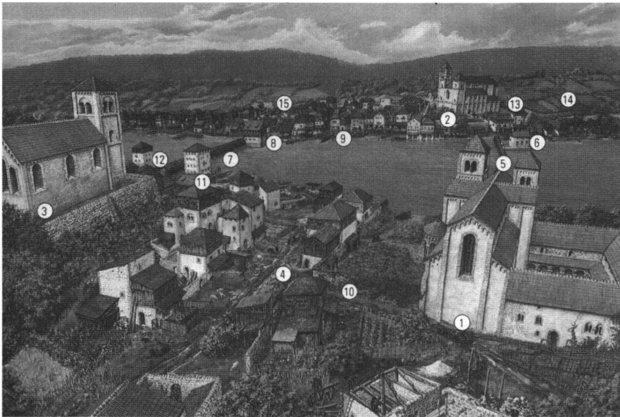
Zürich um 1300. 1 Fraumünster 2 Grossmünster 3 St. Peter 4 Archäologisch gefasste «Ur«-Münsterhof-Häuser 5 Obere Brücke, Fussgängersteg 6 Wasserkirche 7 Untere, ältere Brücke 8 Rathaus 9 Fischmarkt 10 Immunitätsmauer der Abtei Fraumünster 11 Roter Turm 12 Schwert-Turm 13 Hottinger-Turm und Grafenhof 14 Wies- und Rebgebäude 15 Siedlungskern Rindermarkt-Neumarkt.

sich verändernden Lebensformen, der Alltagskultur eben, die sich vornehmlich in «Sachen», in archäologischen Realien wiederfindet.