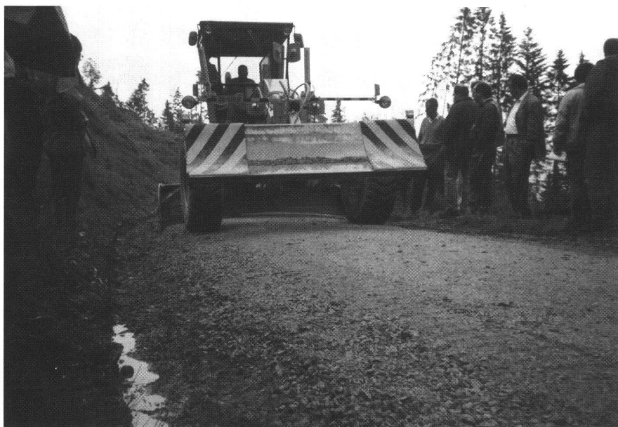
Abb. 4: Der erfahrene Maschinist und der bombierte Schild des Graders schaffen ein optimales Profil.

Die für den Erhalt und Unterhalt von Güter- und Waldstrassen verantwortlichen Personen stehen heute vor einer Vielfalt von Problemen: Weitere Notwendigkeit für Wege in noch schlecht erschlossenen Gebieten, wodurch die ohnehin beschränkten öffentlichen Gelder beansprucht werden; schlechte finanzielle Lage der Eigentümer in Zeiten von Unsicherheit in der Landwirtschaft und tiefen Holzpreisen; gesetzlicher und sachlicher Zwang zur Pflege der bestehenden Anlagen; gesteigerte Mitsprache von aussenstehenden Kreisen. Mit dem zweitägigen Kurs wurde den Verantwortlichen gezeigt, wie unter diesen Rahmenbedingungen die anstehenden Aufgaben möglichst zweckmässig zu lösen sind. Die Fachkompetenz der Referenten, vor allem aber auch das persönliche Engagement der beiden örtlichen Vertreter Stefan Lienert und Franz Walder fanden bei den Teilnehmern ein gutes Echo. Die ausgewogene Mischung von Theorie und Praxis sowie die Gelegenheit zum persönlichen Erfahrungsaustausch werden hoffentlich für andere Weiterbildungskurse der Fachgruppe wieder das Konzept bilden können. Allen Referenten sei an dieser Stelle nochmals herzlich gedankt.