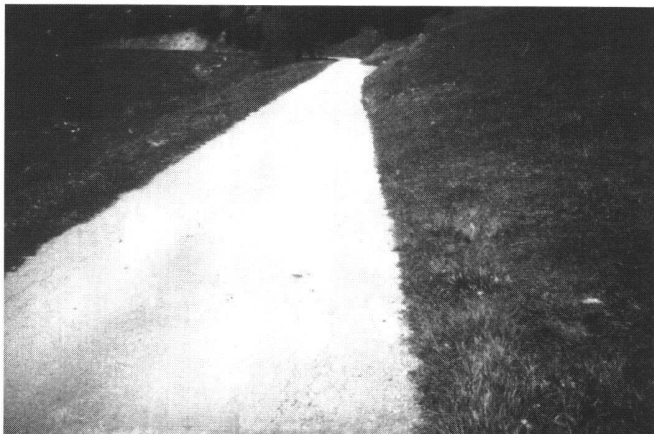
Fig. 2: Entretien courant, entretien périodique ou renforcement?