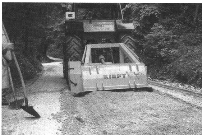
Fig. 3: Démonstration d'un concassage mobile.