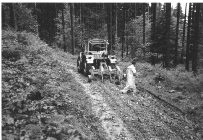
Abb. 1: Vor der Verstärkung wird der alte Strassenkoffer aufgerissen.