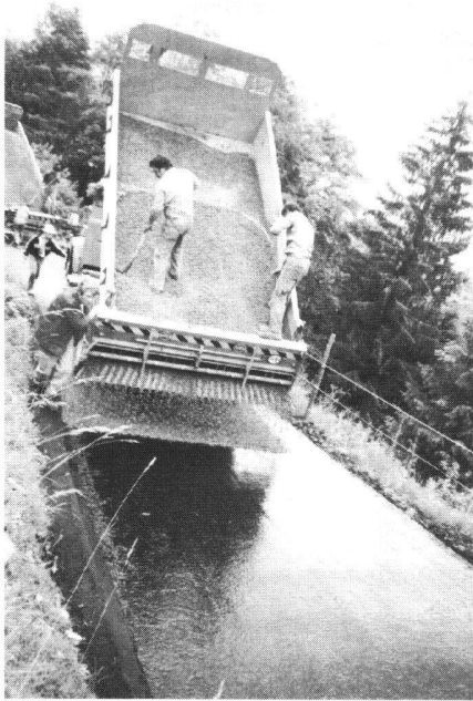
Abb. 3: Einfache OB; der Belagswulst schützt das Bankett gegen Strassenwasser.

ganisation des Unterhaltes in seinem Forstkreis vor und ging auch auf die vor allem aus Gründen des Natur- und Landschaftsschutzes nötigen Fahrbeschränkungen ein. Trotz guten Wegnetzen konnte damit der Autotourismus stark eingeschränkt werden. Leider ist die Umsetzung dieser Methoden auf Güterstrassen in anderen Gebieten häufig wesentlich schwieriger!