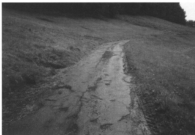
Abb. 2: Hier ist der Unterhalt sicher überfällig!